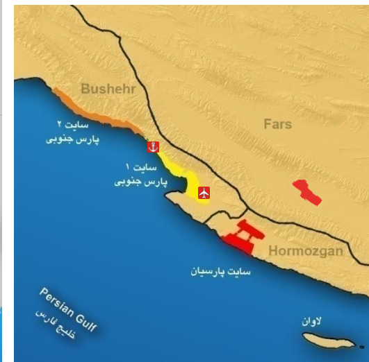
موقعیت منطقه ویژه صنایع انرژی بر در ایران و منطقه