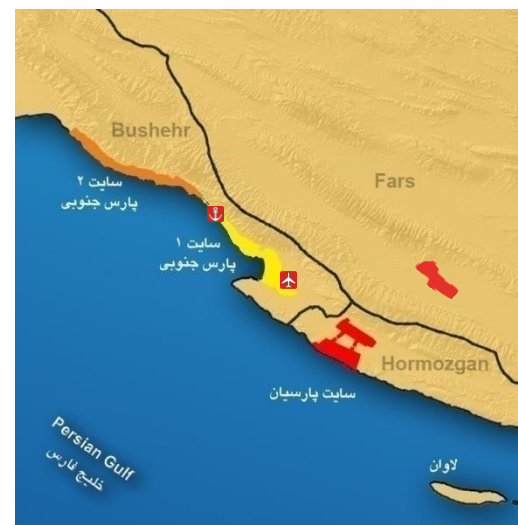
موقعیت منطقه ویژه صنایع انرژی بر در ایران و منطقه