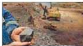
ایمیدرو از شرکت‌های مشاور خصوصی دعوت کرد برای انجام فعالیت‌های اکتشافی سه استان آذربایجان غربی، اردبیل و فارس

حضور یابند. به گزارش روابط عمومی ایمیدرو، این برنامه برای توانمندسازی بخش اکتشاف اجرا می‌شود و در قالب مناقسه به منظور خرید خدمت صورت می‌گیرد. در استان آذربایجان غربی قرار است مطالعات پی جویی منابع معدنی پلی متال در پهنه تکاب پیرانشهر انجام شود. همچنین برای اکتشاف تکمیلی آنومالی‌های پهنه قزل اوزن استان اردبیل، رتبه ۲ مشاوران در تخصص پی جویی و اکتشاف معدن با ظرفیت آزاد ملاک حضور در مناقسه است. از سوی دیگر عملیات اکتشاف در محدوده «پی ۳» بهرام گور استان فارس، از مشاوران دارای رتبه ۳ در تخصص پی جویی و اکتشاف معدن با ظرفیت آزاد، ارزیابی کیفی به عمل می‌آید.