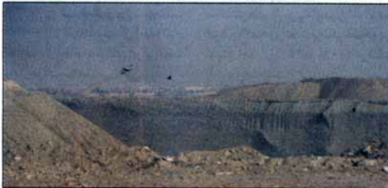
بانزدیک شدن به ماه‌های خشک، باید منتظر افزایش گردوغبار بود.

روی دستگاه‌ها، دپو کردن مخلوط به ارتفاع حدوداً ۶متر، کنترل پساب خروجی و مه‌پاشی و... شن و ماسه تولید می‌کنند.