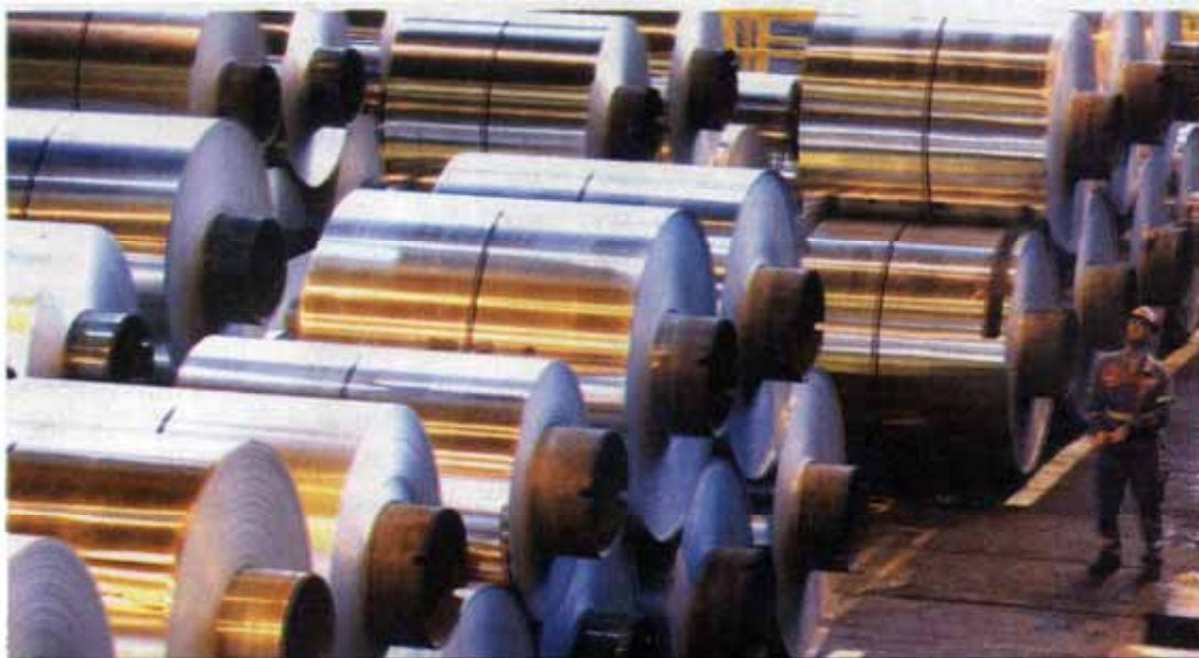
The Iranian government plans to increase aluminum production capacity to 1.5 million tons per year by 2025.

metals, although trade levels have been uneven.