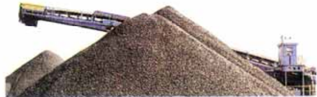
Stockpile of iron ore pellets to be used in steel production.

The global iron ore market faces increasingly severe oversupply, according to Citigroup Inc., which said the commodity's gains will probably be reversed in the second half.