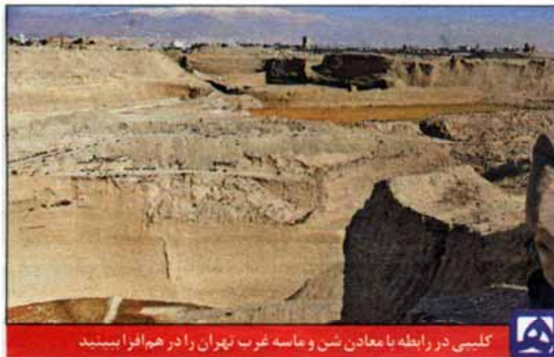
کلیبی در رابطه با معادن شن و ماسه غرب تهران را در هم افزا ببینید

بسیار مرغوب است.» به عقیده این استاد محیط زیست دانشگاه تعطیلی موقت معادن متخلف چاره کار نیست و باید با حمایت صحیح از صنایع، موانع کار برداشته شود. وی اضافه کرد: «به طور نمونه وزارت نیرو، چاه‌های غیرمجاز را پلمب می‌کند اما معادن به خاطر نیاز در جایی دیگر چاه حفر می‌کنند.» نورپور راهکارهایی را در این زمینه ارائه کرد که در زیر می‌خوانید: