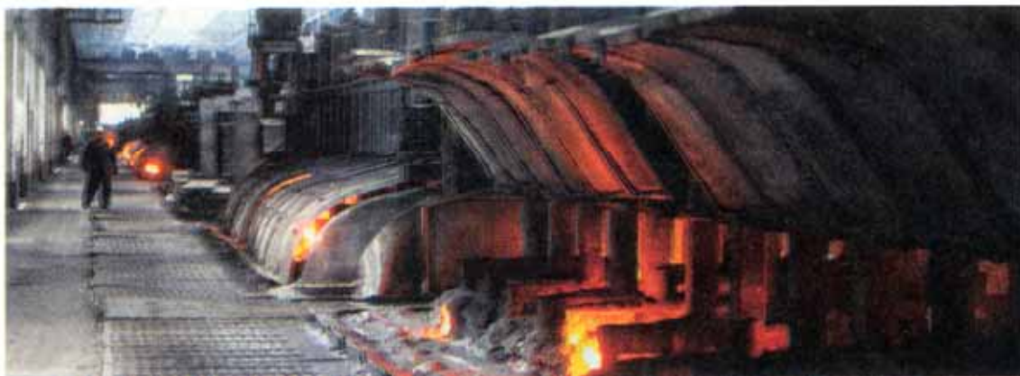
What has prodded Nalco to go for toll-smelting or an aluminum smelter in Iran is the availability of cheap electricity there.

Nalco annually exports about 1 million tons of alumina. If it is converted to aluminum, the topline of the company would go up significantly as the sale price of aluminum is six times that of alumina.