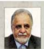
دکتر مهدی کریاسیان رئیس شورای عالی جامعه حسابداران رسمی ایران

پس از پایان جنگ تحمیلی، ماده واحده استفاده از خدمات تخصصی حسابداران ذی صلاح به عنوان حسابدار رسمی در سال ۱۳۷۲ به تصویب مجلس شورای اسلامی رسید و به رغم قدمت بیش از ۷۰ ساله حرفه حسابرسی و تأکید ماده واحده فوق به دلیل سیطره اقتصاد دولتی تا سال ۱۳۸۰ موضوع تشکیل عملی جامعه حسابداران رسمی به طول انجامید. اگر چه از عمر جامعه بیش از ۱۴ سال نمی گذرد، اما نقش و کارکرد همین دوره کوتاه، نشان داده که توانمندی های جامعه غیر قابل انکار است. جامعه حسابداران دارای بیش از ۲ هزار حسابدار رسمی، بیش از ۲۰۰ موسسه حسابرسی و بیش از ۱۰ هزار نفر، مشغول به خدمت در امر شفاف سازی اقتصاد کشور است.