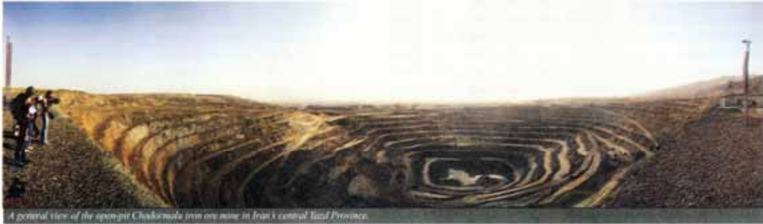
A general view of the open-pit Chaharmahal mine in Iran's central Ilam Province.

largest project contractor for nonferrous metal exploitation and has already cooperated with Iranian firms in projects such as construction of a new plant for Iran Aluminum Company, establishment of Iran Alumina Company and Mahdi Hormozal Aluminum Company.