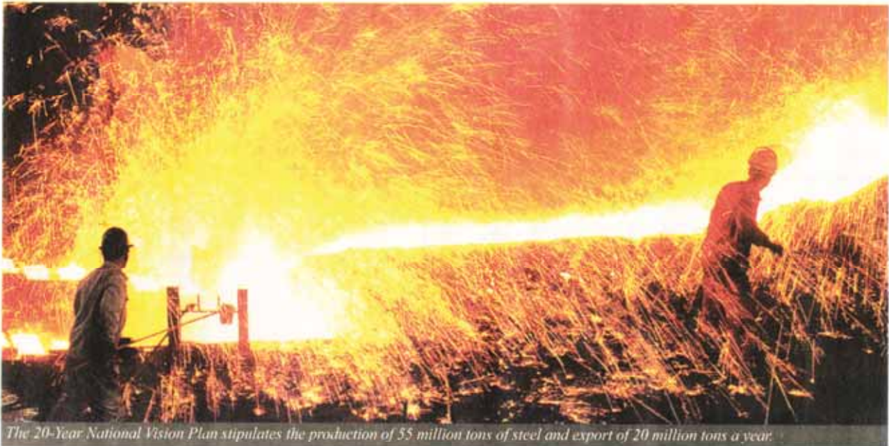
The 20-Year National Vision Plan stipulates the production of 55 million tons of steel and export of 20 million tons a year.

it uses a minimum amount of energy and is highly secure and considerably more environment-friendly compared to land transportation.