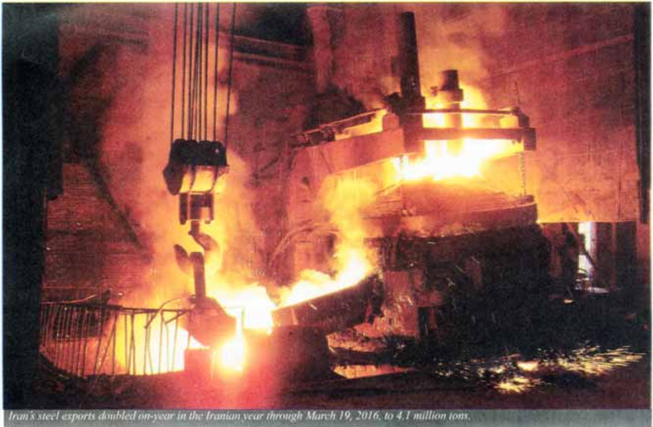
Iran's steel exports doubled on-year in the Iranian year through March 19, 2016, to 4.1 million tons.