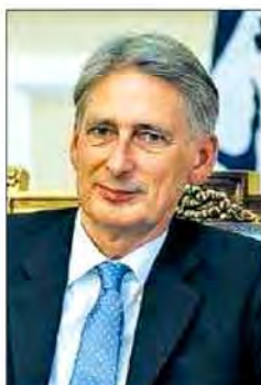
فیلیپ هاموند وزیر خارجه انگلیس