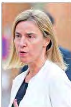
فدریکاموگرینی مسئول سیاست خارجی اروپا