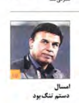
امسال دستم تنگ بود مخالف دولتی شدن شهر داری هشتم عزم جدیدی خلق می‌شود