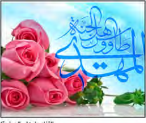
التفاصيل على الصفحة ۸

في ذكرى مولد آخر خليفة الهمية للبشرية.. الامام المهدي.. المصلح الكبير والمنقذ الموعود