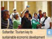
Soltanifar: Tourism key to sustainable economic development