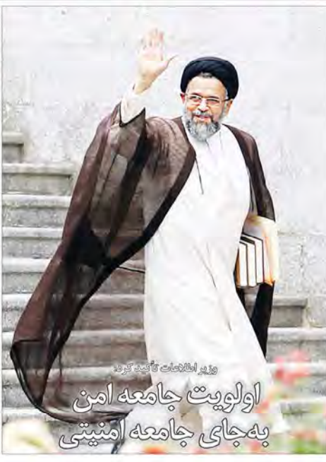
وزیر اطلاعات تأکید کرد اولویت جامعه امن به جای جامعه امنیتی

در نشست هم‌اندیشی فعالان انتخاباتی اصلاح طلب مطرح شد