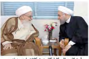
آیت‌الله صافی گلپایگانی: مشکلات با حسن تدبیر جنابعالی برطرف خواهد شد