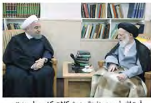
آیت‌الله شبیری زنجانی: مشکلات کشور با وحدت و تلاش همگانی حل‌شدنی است