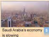
Saudi Arabia's economy is slowing