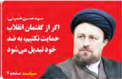
سید حسن خمینی اگر از گفتمان انقلاب حمایت نکنیم، به ضد خود تبدیل می‌شود

شنبه اول خرداد ۱۳۹۵ ۱۴ شعبان ۱۴۲۷ هـ ق. ۱۳ - ۱۴ سال اول دوره جدید - شماره ۸ - ۱۴۲ صفحه ۵۰۰ تومان