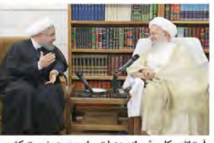
آیت‌الله مکارم شیرازی: دولت برای بهبود وضعیت کشور به موفقیت‌های خوبی دست یافته است