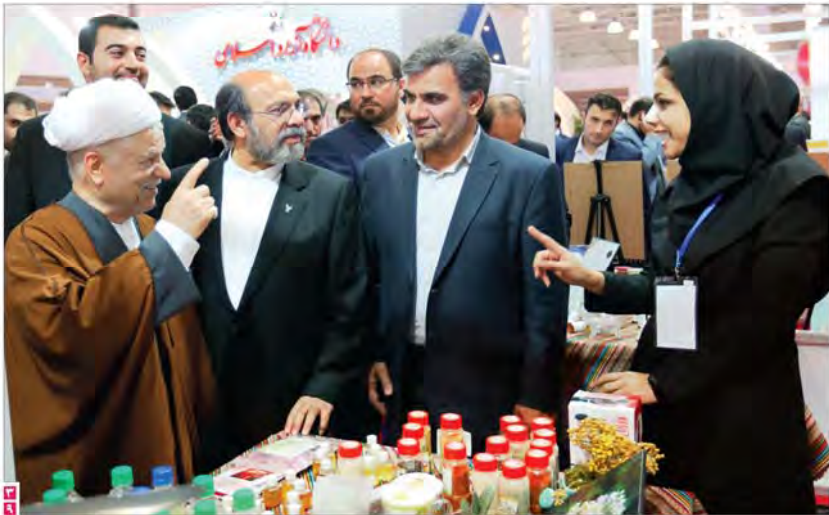
آیت‌الله هاشمی رفسنجانی در حال بازدید از غرفه محصولات دانشگاه آزاد اسلامی در نمایشگاه بین‌المللی تهران