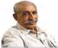
همه از نادر روی برگرداندند