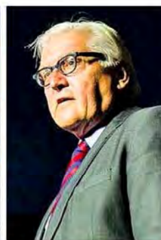
فرانک والتر اشتان مایر وزیر خارجه آلمان

شاگردان «بنا» پنجمین جام را بالای سر بردند