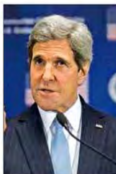
جان کری وزیر خارجه امریکا