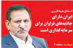
سخای جهانگیری ایران دارای جاذبه‌های فراوان برای سرمایه‌گذاری است