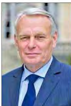
ژان مارک ارو وزیر خارجه فرانسه