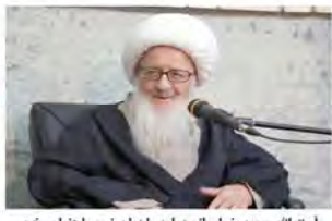
آیت‌الله وحید خراسانی: باید با زبان نرم با دنیا سخن گفت و تعامل سازنده داشت