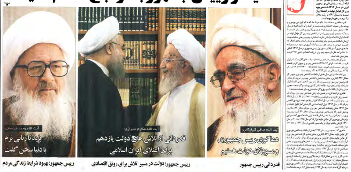
دیدار رییس جمهور با مراجع عظام تقلید آیت الله محمدتقی گلپایگانی آیت الله محمدتقی جعفری آیت الله محمدتقی مصباح آیت الله محمدتقی خلیلی

به مناسبت یکم خرداد روز ملی بهروری شاخص بهره وری ۱۲۲ درصد افزایش یافت مهندس گل محمدی در مراسم افتتاحیه برنامه‌ها و سیاست‌های کلان مرکز آغاز ایران گفت: براساس آمارهای ارژان در سال ۱۳۹۴ شاخص بهره واری کل عوامل تولید در اقتصاد ایران نسبت به سال ۱۳۹۳ از رشد معادل ۱۲۲ درصد برخوردار بوده است.