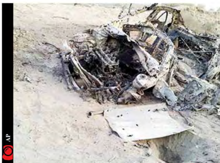
ملا اختر منصور