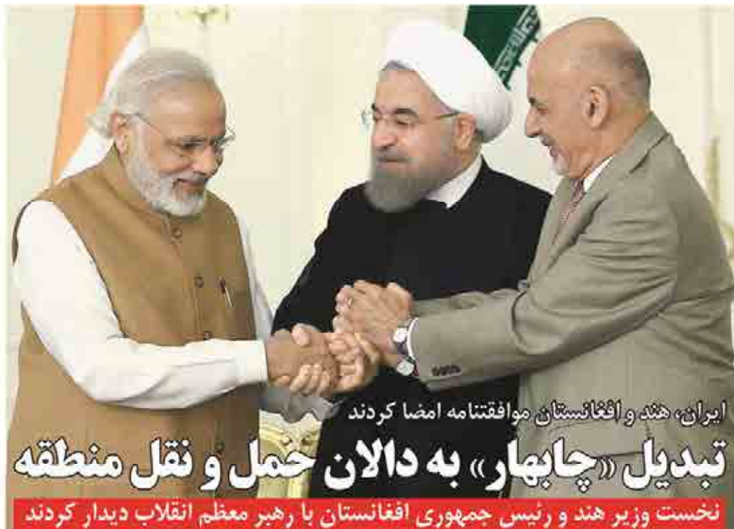
ایران، هند و افغانستان موافقتنامه امضا کردند تبدیل «چابهار» به دالان حمل و نقل منطقه نخست وزیر هند و رئیس جمهوری افغانستان با رهبر معظم انقلاب دیدار کردند

افزایش داده و هند را از طریق افغانستان به آسیای میانه و در مقابل زمینه دسترسی افغانستان به هند را از طریق دریا فراهم می‌سازد. علاوه بر این روز گذشته، دولتمردان دولت ایران و هند ساعات پرکاری را در تهران سپری کردند.