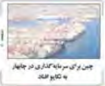
چین برای سرمایه‌گذاری در چهار به تکیه افتاد