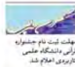
مهدت کت نام جشنواره قرآنی دانشگاه علمی کاربردی اعلام شد