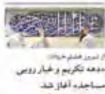
از امور خیریه‌ها، ماهه تکوین و خیرات رویت مساجد آغاز شد