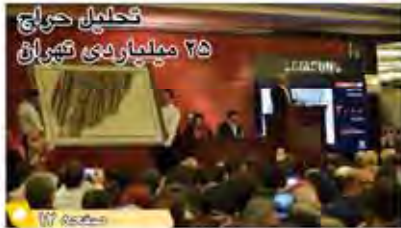
تکمیل کرایج ۲۵ میلیاردی کثیران

نوبت خبرها: اقتصاد در حال خروج از رکود است