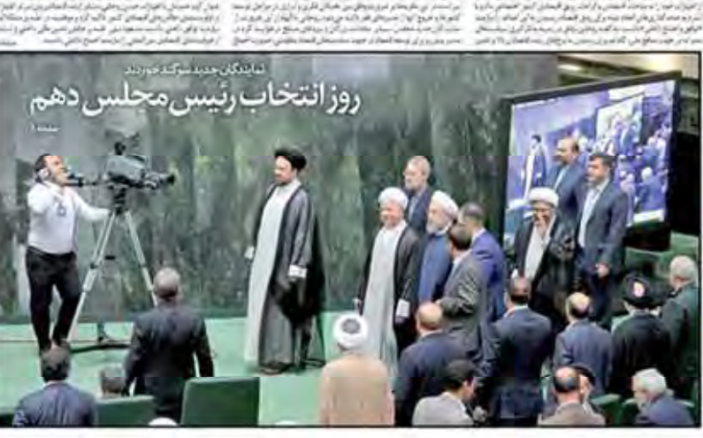
روز انتخاب رئیس مجلس دهم

سرمایه کمیت مجلس و توسعه مسئولان مجلس دهم با ۱۱۰ نماینده در ۱۷ صحنه انتخاب شد. این مجلس در ۱۷ صحنه انتخاب شد و ۱۱۰ نماینده دارد. این مجلس در ۱۷ صحنه انتخاب شد و ۱۱۰ نماینده دارد.