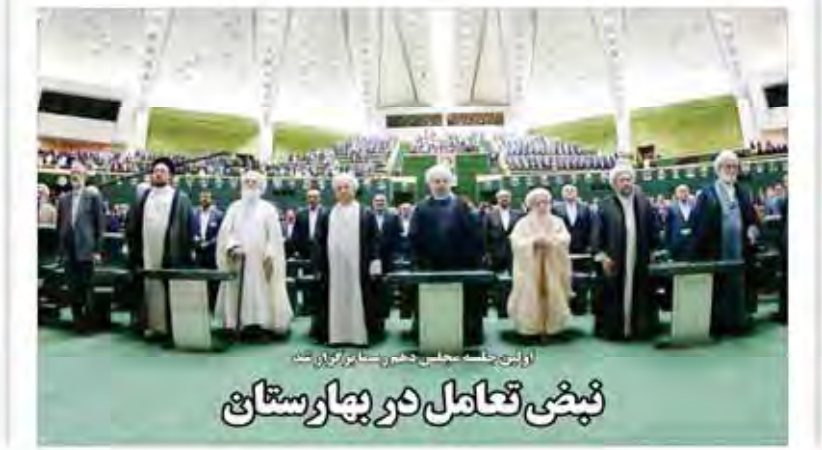
آغاز پنجمین جلسه هیئت مدیره و هیئت رئیسه در بیمارستان نیمی تعامل در بیمارستان

گروه صنعتی خودرو و تجارت ایران با همکاری وزارت صحت، با عرضه خودروهای لوکس در بازار دارو، ابهام ۴ ساله این صنعت را برطرف کرد.