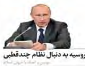
روسیه به دنبال نظام چندقطبی جهان و اعتقاد به شیون‌سالاری

رسانه ایرانی اسلامی؛ سوری برای سیر سازمان تبلیغات اسلامی با همکاری دولت سوریه، رسانه‌های تبلیغاتی برای سیر در سوریه توزیع کرده است. این اقدام به منظور تقویت همکاری‌های منطقه‌ای است.