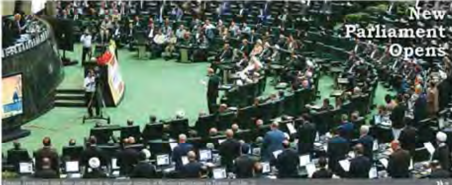
New Parliament Opens

Latin America needs a new formula to achieve sustainable development, said a regional meeting before ending in Mexico City late Friday. The 36th session of the United Nations Economic Commission for Latin America and the Caribbean highlighted "for a new political economy—a new equation between the state, the market and society—and new international and national coalitions", Xelhua reported. "The contrasted development pattern in Latin America is