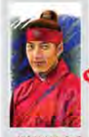
کمیسیون آموزش عالی می‌خواهد تا ۶۰ سالگی بازگیری جذابیتش

تعدادی از دانش‌آموزان سبزکوه در سبزکوه (۱۳۵۰ نفر) در خراسان جنوبی تظاهرات کردند و نسبت به سختی امتحانات نهایی اعتراض کردند. آنها در مقابل مدارس و مراکز آموزشی تظاهرات کردند و با شعارهای اعتراضی، خواستار لغو امتحانات نهایی شدند.