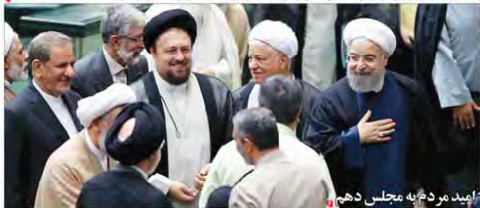
امید مردم به مجلس دهم

فرماندهای جدیدی از گمشده با طرف کره ای در وزارت صنعت معدن و تجارت کرمانشاه به همین مناسبت در تهران امضاء شد. همچنین در این دیدار با وزیر صنعت، معدن و تجارت مطرح شد. همچنین در این دیدار با وزیر صنعت، معدن و تجارت مطرح شد.