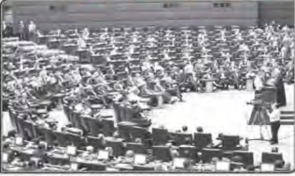
MPs listen to President Hassan Rouhani addressing the opening of the new parliament in Tehran, May 28, 2016.