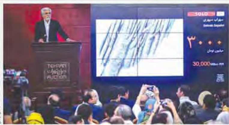
شب تاریخی حراج تهران: