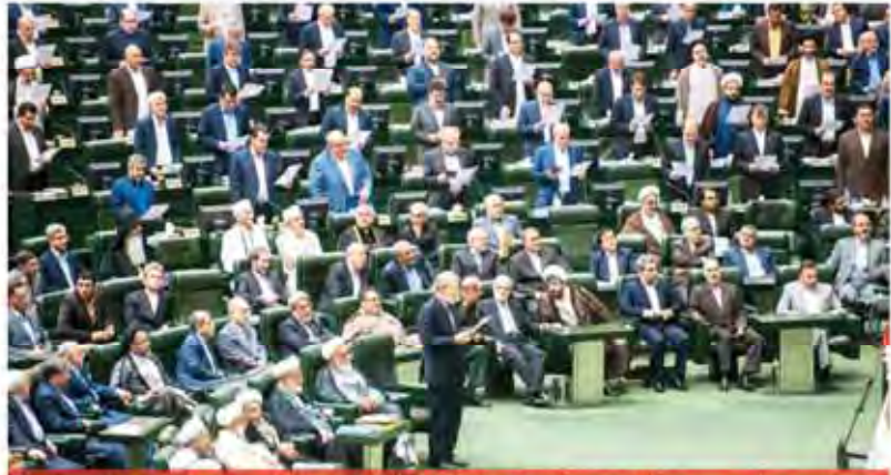
Economy, culture underlined in Leader's Parliament inaugural message