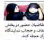
مناقضین حضور در بخش عفاف و حجاب نمایشگاه قرآن مجله کند

یکشنبه ۹ خرداد ۱۳۹۵ - شماره ۲۲۲ - تهران - ۲۲ خرداد ۱۳۹۵ - شماره ۲۲۲ - تهران - ۲۲ خرداد ۱۳۹۵