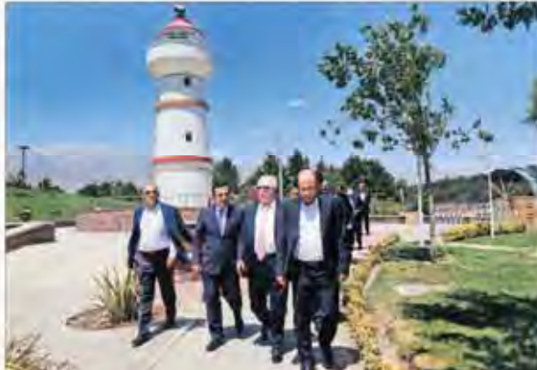
شهردار وین: تصویر تهران با تصور قبلی ما قابل مقایسه نیست میثاق‌هاویل برای امضای تفاهنامه همکاری با شهرداری تهران در پایتخت به سر می‌برد