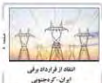
انتقاد از فراداد وای ایران - کره جنوبی

در موفقیت‌ها یا مشکلات همه قوا در نظام سهم دارند