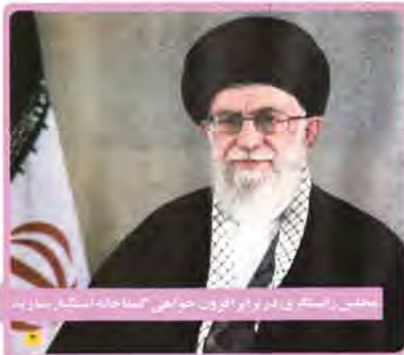
مجلس رئیسی در برابر افزون خواهی گستاخانه استکبار بسازند

تضمین انتقال فناوری در قراردادهای جدید نفتی محکمتر شده است