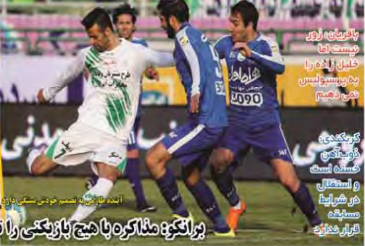
آمده بازیکن به تصمیم خودش سبکی دارند

برانکو: مذاکره با هیچ بازیکنی را نباید نمی کنیم