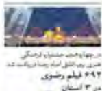
در پی راهپیمایی عظیمی که در تهران برگزار شد، ۶۴۲ فیلم روستوی در ۳ استان