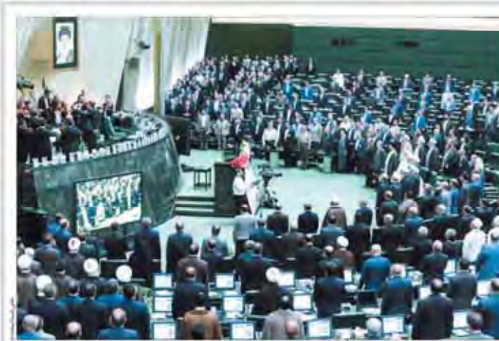
تواضع افتتاحیه و فراتر سوگند مجلس دهم با پیام رهبر معظم انقلاب اسلامی مجلس را سنگری استوار در برابر استکبار بسازید

درست همان روز که رهبر انقلاب گفت «ایران با اقتدار از غرب امتیاز گرفت نه با مذاکره»، وندی شرمن عضو سابق تیم مذاکره کننده امریکادر ۵۰۱ لیبی اعتراف کرد جهان در سال‌های اول قرن ۲۱ که ایران تنها ۱۶۴ سانتی‌مقیوز داشت، برای توافقی هسته‌ای آماده نبود و زمانی آماده توافقی شد که سانتی‌مقیوزهای ایران به ۱۹ هزار رسید.