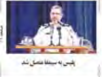
پسین به سینه‌ها نشاند