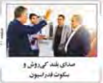
صدای بلند کی‌روش و سیکوت قدرسیون