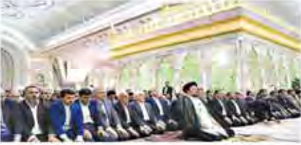
با حضور در مرکز بهائیکادر شیراز