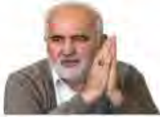
مجلس دهم چه کند