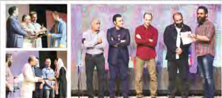
مرکز آزمون وزارت علوم، تحقیقات و فناوری، تهران، در مراسم ثبت نام آزمون کاردانی به کارشناسی ناپیوسته سال ۱۳۹۵

نظارت دقیق بر ورزشگاهها و استخرها با هدف ارتقا سطح بهداشت