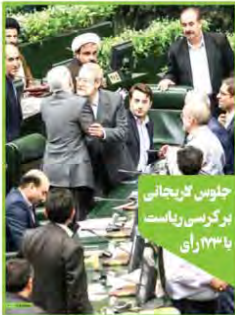
جلسه کاریجانی برگردنی ریاست با ۱۳۳ رای

تکرار می‌کنیم: آقایان توجیه نکنید تکرار می‌کنیم: آقایان توجیه نکنید تکرار می‌کنیم: آقایان توجیه نکنید