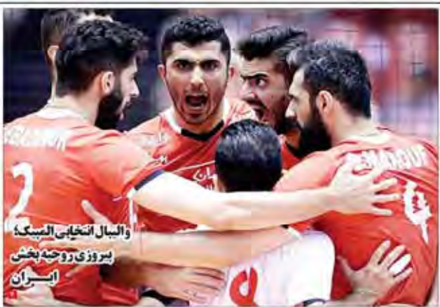
والبال انتخابی الممسک! پیروزی روحیه بخش ایران

ابلاغ تکالیف انضام‌مقدماتی وزارت اقتصاد معاون اول رئیس‌جمهور، دکتر روحانی، در جلسه‌ای با اعضای هیأت مدیره وزارت اقتصاد، تکالیف انضام‌مقدماتی این وزارتخانه را ابلاغ کرد.