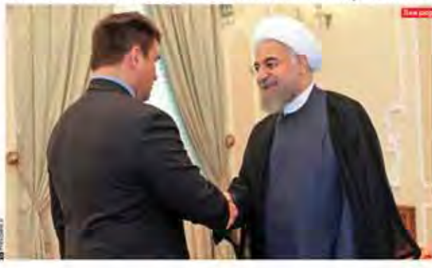
President Hassan Rouhani is seen shaking hands with a man in a suit during a meeting.