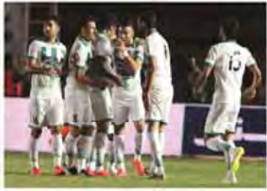
خدا می داند روحم خبر دار نیست

استقلال یک (در ضربات پنالتی ۴) ذوب آهن یک (در ضربات پنالتی ۵) خدا حافظی استقلال با مظلومی