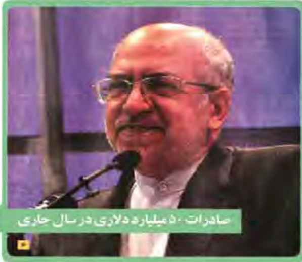
صادرات ۵۰ میلیارد دلاری در سال جاری

مجلس ریاست موقت مجلس ریاست موقت مجلس ریاست موقت