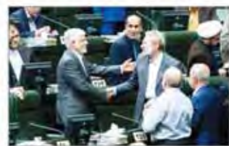
Iranian lawmakers voted Ali Larijani as the temporary speaker of Iran's 10th Parliament following February elections. Larijani, the son-in-law of the late President Mahmoud Ahmadinejad, is certain to secure the position. On Saturday, President Hassan Rouhani praised Larijani for supporting Iran's nuclear pact and called for greater "transparency" in the process.

An Official in the Oil Ministry Says Export of Crude to South Africa Still Awaits Resumption Because No Talks Have Been Held for Resumption