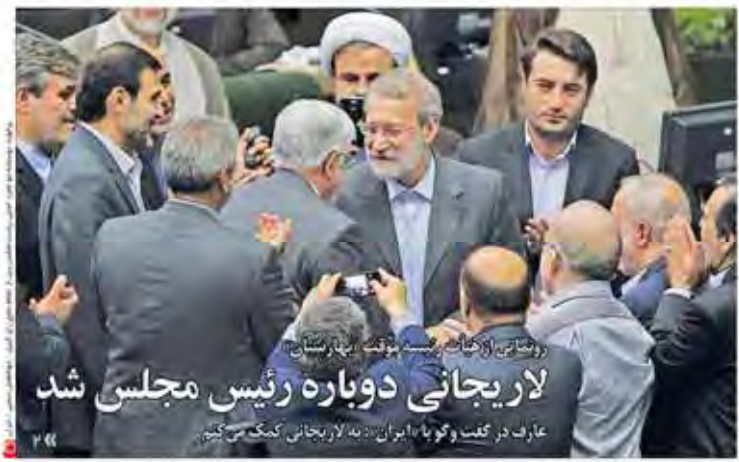
لاریجانی دوباره رئیس مجلس شد

مرکز آماز: نرخ تورم روستایی تک رقمی شد بر خورد با شهریه‌های غیر قانونی مدارس