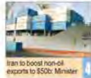
Iran to boost non-oil exports to $50b: Minister

Number 5363 • Monday May 30, 2016 • Khorad 10, 1395 • Sha'ban 23, 1437 • Price: 5,000 Rials • 32 Pages • www.irandailyonline.ir