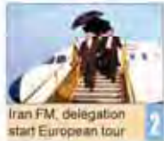
Iran FM, delegation start European tour