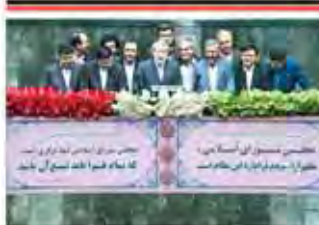
هیات رئیسه موقت مجلس دهم انتخاب شدند

رئیس مجمع تشخیص مصلحت نظام: تصویب و اجرای برجام آغازی برای تحول جدید روابط دنیا با ایران است.