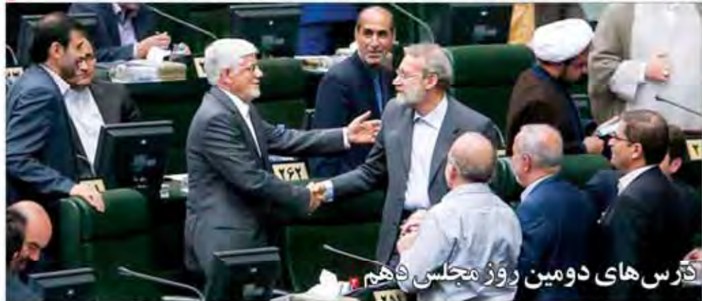
درس‌های دومین روز مجلس دهم

بسته حمایت از صادرات غیر نفتی از نخستین روز این هفته با حضور وزیر صنعت، معدن و تجارت، مسئولان وزارت و مدیران بخش‌های دولتی و خصوصی در جمع بازرگانان رونمایی شد. در این نشست، وزیر صنعت، معدن و تجارت با حضور مدیران بخش‌های دولتی و خصوصی در جمع بازرگانان رونمایی از بسته حمایت از صادرات غیر نفتی کرد.