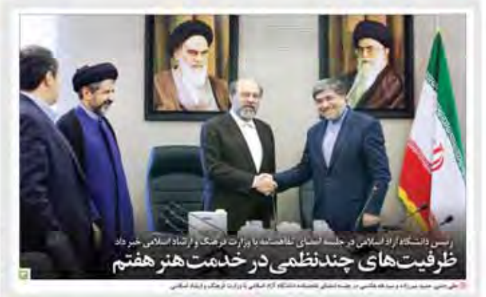
رئیس دانشگاه آزاد اسلامی در جلسه‌ای با اعضای هیئت مدیره و اساتید دانشگاه حضور داد

وزیر صنعت سرمایه‌گذاری در سالهای اخیر افت داشته است. باید تلاش شود تا کار تک‌بخشی شود. وزیر نیرو مشکلات پستی روی ما هم سرمایه‌گذاری در صنعت و اقتصاد پستی است. وضعیت آب به بزرگ‌ترین چالش توجه‌مان رسیده است.