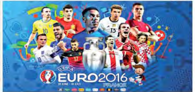
پرونده مردم سالاری: در آستانه رفتن فوتهای فوتبال پورو ۲۰۱۶ نیمی فوتبال در فرانسه می‌زند