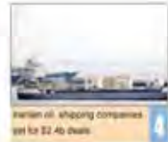
Iranian oil, shipping companies strike $2.4b South Korean ship deal

Number: 5370 • Wednesday June 8, 2016 • Khordad 19, 1395 • Ramadan 2, 1437 • Price: 5,000 Rials • 12 Pages • www.irandailyonline.ir