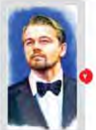
دی کاپریو مولایمی شود

سازمان ملل غیر بیست و نه ساله هر روز در لیست سیاه نگه داشته است