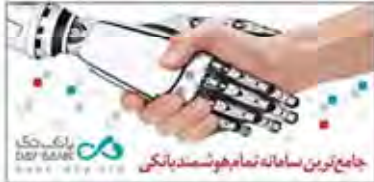
جامع ترین سامانه تمام هوشتندباتکی