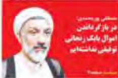
سخنرانی در نمازگاه امامان توفیق بنی‌هاشمی