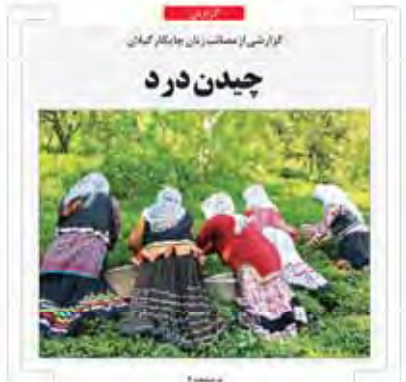
گزارشی از محاصره زانل جامانگ کمان چیدن درد

کمیته اضطرار آلودگی هوای تهران تشکیل جلسه داد ۱۵ استان کشور زیر سایه گرد و غبار عراقی