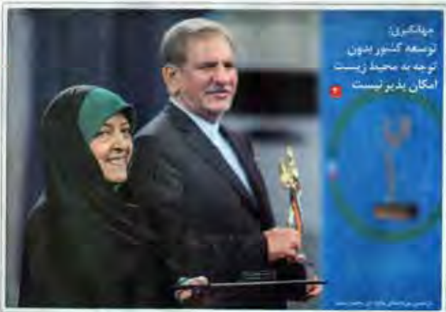
میانگویی توسعه کشور بدون توجه به محیط زیست امکان پذیر نیست

تشریح اقدامات دولت در زمینه اقتصاد مقاومتی