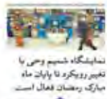
نمایشگاه ششمین و پنجمین رویداد با موضوع مبارزه با فساد و ارتقاء فرهنگ و اخلاق در سازمانها برگزار شد

مطابق مشق مهمان تلفظ قرآنی همه این مزایا را به جانش می بخشد و خطای لغوی و خطای فکری را از او دور می کند