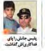
پایس جانش را پای فداکاری اش گذاشت

رهبر معظم انقلاب / است و / تازه / به / بدون / استقلال / که از