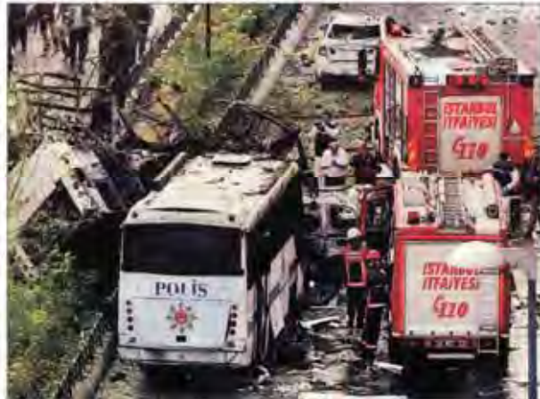
انفجار، استانبول را لرزاند / نزدیک به ۲۰ شتر در انفجار روز گذشته در منطقه تاریخی و عظیمی استانبول کشته و زخمی شدند

حدود ۱۰ میلیون نیازمند روز گذشته با وعده دریافت سبد کالا اقطار کردند و این بار شنبه روز توزیع سبد غذایی اعلام شد