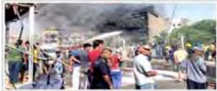
انفجار در نزدیکی بین الحرمین

از سوی مصطفی کاتانچیان طی اظهار قانون اساسی صورت گرفت درخواست جلسه غیر علنی برای بیان مشکلات اقتصادی کشور