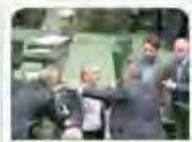
بازرسی‌های امنیتی در مجلس یقه گیری در خانه ملت

همدلی، روز گذشته، ویژه ایثار در فضای مجازی با انتشار تصاویر برخی از چهره‌های سیاسی و مدیران ارشد نظامی ممنوع تصویر و غیره در این رسانه‌ها، عملاً ممنوع تصویر پوشش آن‌ها را برپا کرد.