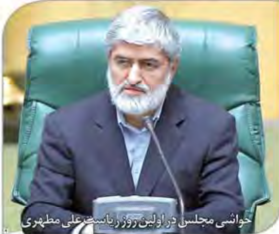
خواشی مجلسین در اولین روز ریاست علی مطهری

گزارش‌های اقتصادی روز روزگرن در دهه است که خبر از بازگشت ایران به بازار نفت پس از لغو تحریم‌ها می‌دهد. این گزارش‌ها نشان می‌دهد که ایران در حال حاضر به یکی از بزرگترین صادرکنندگان نفت در جهان تبدیل شده است. این امر به دلیل توافق هسته‌ای است که به ایران اجازه می‌دهد تا نفت خود را به بازارهای جهانی صادر کند. این امر به نفع ایران است زیرا به او کمک می‌کند تا درآمد خود را افزایش دهد و به اقتصاد خود کمک کند. این امر همچنین به بازار نفت جهانی کمک می‌کند تا به تعادل خود برگردد.