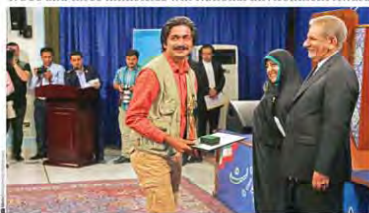
NGOs and three ministries win National Environment Award