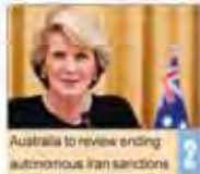
Australia to review ending autonomous Iran sanctions