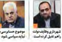
موضوع حسابرسی ها نباید سیاسی شود