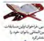
دین، فرهنگ و آیین مسابقات بین المللی بانوان خود را منتشر کرد