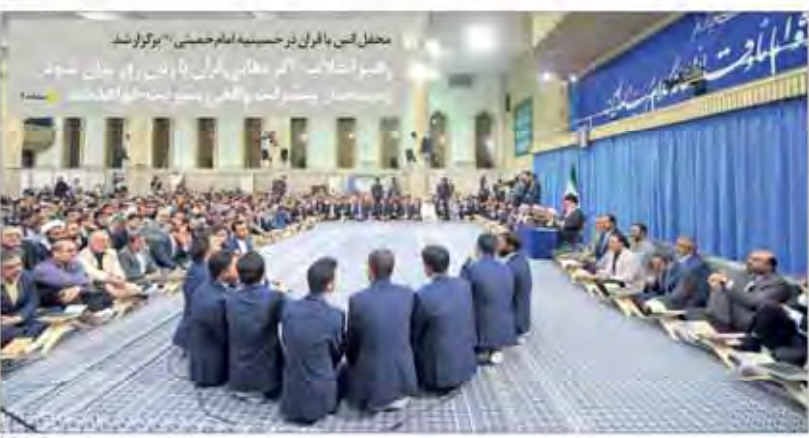
مجلس قس با قرآن در حسینیه امام خمینی برگزار شد