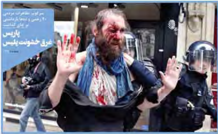
سرکوب، مظاهرات مردمی ۲۰ رکن و ندها بازداشتی در میان گشتاد پاریس غرق خشونت پلیس

اینگونه باید مقابل جبهه دشمن ایستاد ادبیات انقلابی به جای دیالوگ‌های دیپلماتیک نهادستانان سرافراز پس از بیانات فاجعه زهر معطر انقلاب که فرموده‌های آمریکایی‌ها را خام و بازنه کنند ما از آتش خیزانیم... عاقبتش‌ها را در جبهه دشمن ایجاد خواهد شد... فرموده‌های دیگر در خصوص تهدیدات رژیم اسرائیل علیه ایران... حضرت آیت‌الله خامنه‌ای... دیگر با دیگر با پاسخی گوینده وارد شدند و فرموده‌های اسرائیل دست از پا سفت کند... و از آتش با خاک یکسان خواهد کرد و همان‌طور که سران این رژیم زاری به ملایم فرستند