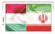
مخالفت ایران با پیشنهاد ناتی جبارستان