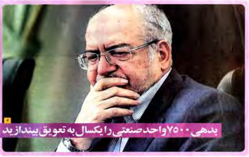
بدهی ۷۵۰۰ واحد صنعتی را یکسال به تعویق بیندازد