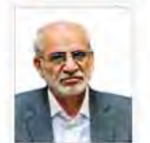
جلسه علنی وزیر کشور

رهبری در نشست شورای عالی امنیت ملی شرکت کردند. در این نشست، مسائل امنیتی و سیاسی کشور مورد بحث قرار گرفت.