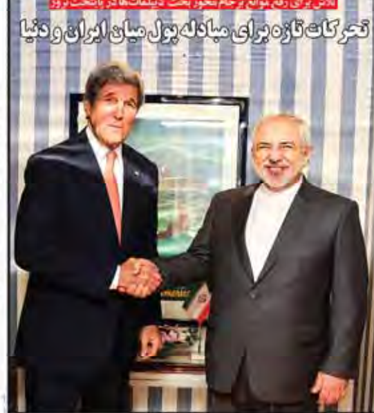
تحرکات تازه برای مبادله پول میان ایران و دنیا

تلاش برای رفع موانع برجام بخاطر بحث در مذاکلات نو