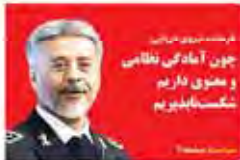
فرمانده نیروی هوایی چون آماده‌گی نظامی و مصوب داریم شکست‌ناپذیریم