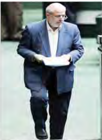
باجش خصوصی و بانکها بر گزینین حاکمان چیت چیلان هستند