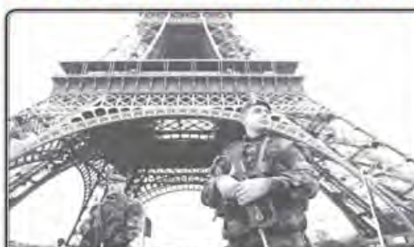
Members of the French Foreign Legion guard near the Eiffel Tower on Nov. 16, 2015

He took the couple's three-year-old son hostage in Monday night's attack. The boy was found unharmed but in a state of shock after police commanders secured the house and killed the attacker. Media reports on Wednesday said a fresh wave of Takfir militants has left Syria and could commit attacks momentarily in France and Belgium. "Fighters travelling around and planning to carry out attacks in groups of two and 'their action is imminent,'" the La Dernière Heure newspaper reported. European governments were reportedly warned of a Takfir backlash when they began supporting militants in their bid to topple the Syrian government. Those stream have come to join in