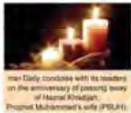
Iran Daily concludes with its readers on the anniversary of passing away of Hazrat Khodabakhsh, Prophet Muhammad's wife (PBUH).