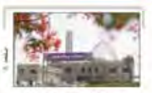
زدودن شمار از چهره های صلابت کیش با نسیم همدانی