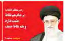
رئیس‌جمهور ایران و هم‌نظایر حکومت‌ها و هم‌نظایر حکومت‌ها

پنجشنبه ۲۷ خرداد ۱۳۹۵ شماره ۱۳۳۲ - ۱۶ خرداد ۱۳۹۵ ۵۰ تومان