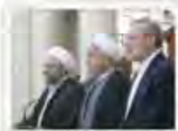
امید را ترویج دهید

عبدعلی - هر چه سابقه ایران و عربستان را بررسی می‌کنیم، می‌بینیم که این دو کشور در طول تاریخ روابط دوستانه داشته‌اند. اما در سال ۱۳۹۵، این دو کشور به دلیل حمله به سفارت عربستان در تهران، روابط خود را قطع کردند. این حمله در شب ۲۴ خرداد ۱۳۹۵ در خیابان نیلوفر تهران رخ داد. در جریان این حمله، سه شهروند ایرانی کشته شدند و ده‌ها نفر زخمی شدند. این حمله باعث قطع روابط دیپلماتیک بین ایران و عربستان شد.