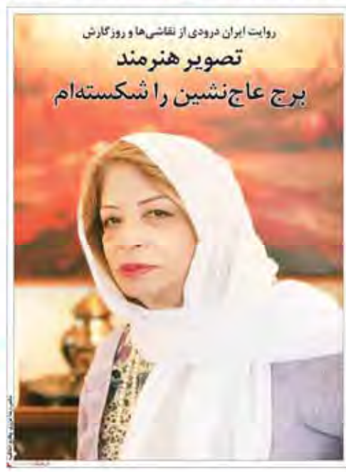
روایت ایران درودی از نقاشی‌ها و روزگارش تصویر هنرمند برج عاج‌نشین را شکسته‌ام

رسانه‌ها و فضای امید رسانه‌ها باید فضای امید را در جامعه گسترش دهند. با پوشش صحیح اخبار و تحلیل‌های سازنده، می‌توانند به بهبود روحیه مردم کمک کنند.