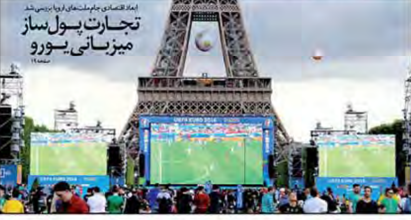
ایمپراتور اقتصادی جام ملت‌های اروپا برپایی شد