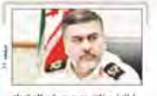
راه له نهادت جدید به متحولان ایران به خدمت و منتقل