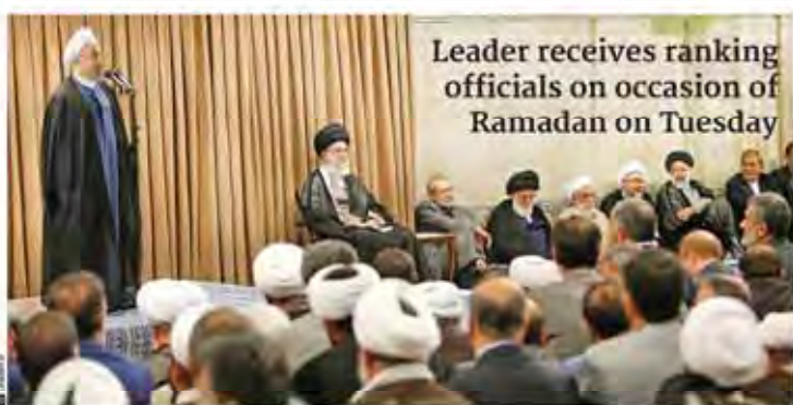
Leader receives ranking officials on occasion of Ramadan on Tuesday

He also said Iranian women have good opportunities for higher education.