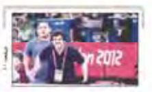
فرست های زبانی را از دست دادیم