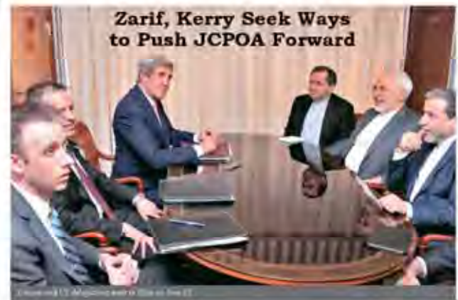
Zarif, Kerry Seek Ways to Push JCPOA Forward

Rouhani championed the deal with his opponents that Iran (permanent members of the UN Security Council plus Germany) with a view to opening the stagnant domestic market and key economic sectors to foreign investment and modern technology.