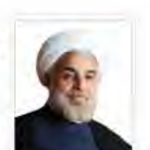
رهبری در نشست شورای عالی امنیت ملی

رهبری در نشست شورای عالی امنیت ملی شرکت کردند. در این نشست، مسائل امنیتی و سیاسی کشور مورد بحث قرار گرفت.