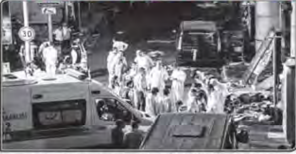
Forensic police work the explosion site at Ataturk Airport on June 28, 2016 in Istanbul after two explosions followed by gunfire hit Turkey's biggest airport.

though some were foreigners, Turkish said. The three militants were killed when they demanded their explosives, he said. One Iranian national lost his life in the terrorist attack, a Foreign Ministry official in Tehran said. Deputy Foreign Minister Hassan Qasbi said five other Iranians sustained injuries. Iraq suspended all flights to Istanbul's main international airport on Wednesday. "Due to last night's explosion at Ataturk Airport, all Iranian flights are suspended until their safety and security are guaranteed," Haza Farahmandi, the director of the public relations in Iran's Civil Aviation Organization, said. Outside the terminal on Tuesday night, as calls went on on local news channels for blood donors and the Turkish authorities imposed a law on publishing images of the scene of the explosion.