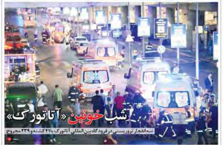
شب خونین آتاتورک در فرودگاه بین‌المللی آتاتورک با ۲۱ کشته و ۲۳۹ مجروح

کارشناسان سیاسی توسعه کشور را در گرو همکاری همه‌جانبه دانستند.