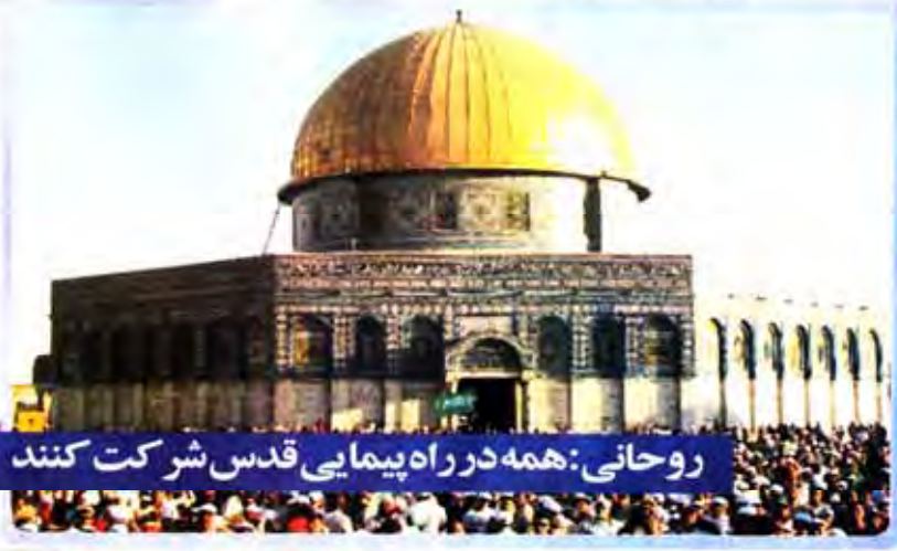
روحانی: همه در راه پیمایی قدس شرکت کنند