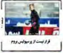
فراتر از پروپاگنדה