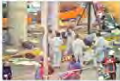
۳۰ تیر ۱۳۹۵ جولان تورویست‌های داعش در فرودگاه اسلامبول