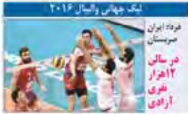
لیگ جهانی والیبال ۲۰۱۶