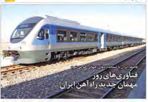
فناوری‌های روز مهمان جدید راه آهن ایران

توسعه صنعت نساجی و صادرات صنایع نساجی ایران، نیازمند توجه ویژه به تحریک تقاضا و بهبود کیفیت محصولات است. در این مقاله به بررسی راهکارهای توسعه این صنعت می‌پردازیم.