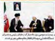
در نشست موسوم به روز مام‌سازک در تهران رئیس و مدیران دستگاه قضایی میهمانان افکار نظامی حاضر می‌شوند.