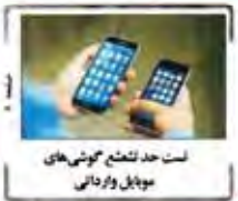
لست حد شمع گوشی‌های موبایل واردانی