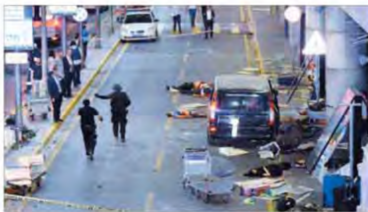
تروور مستحضر همزمان با نطق رهبر خراسانی از دیوان به پوتین، فرودگاه استانبول راه جرم کشیدند