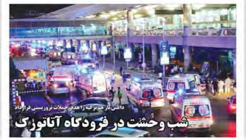
شب وحشت در فرودگاه آنا تورک

گزارش «صنعت» از ارائه دولت یازدهم در زمینه فضای عمومی صنعت، نویدبخش و امیدوارکننده است. در دولت یازدهم، فضای عمومی صنعت به یک حوزه کلیدی در برنامه‌های اقتصادی تبدیل شده است. این دولت با اتخاذ تدابیر مناسب، به بهبود فضای عمومی صنعت پرداخته و تلاش کرده است تا با رفع موانع و تسهیل فرآیندهای اقتصادی، به جذب سرمایه‌گذاری و افزایش تولید در بخش صنعت کمک کند.