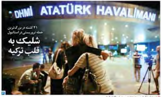
مشاهده از گنجی در پشت جداره آبرویش فرودگاه استانبول.

گزارش طرح‌های جنگل‌افزایی موسسه سبک‌سازها در زاهدان اولین