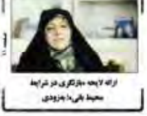
راه لایحه بازگویی در شرایط محیاتی با بازویی