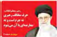
حرف مخالف رهبری نه جرم است نه مدار صدای با آن می‌شود

شماره ۱۰۰۰ ۲۰۰۰ شماره ۱۰۰۰ ۲۰۰۰ شماره ۱۰۰۰