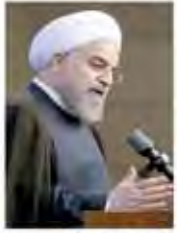
۱۹ خرداد رئیس‌جمهور با اشاره به بررسی پرونده آقای خاتمی گفت: این کار درنگ با کمک هم انجام می‌دهیم و صحبت‌ها همین بوده که همه می‌دانند. هر جا که شهادت می‌خواهد موجود شود، فراموش نکنیم و این شعارها با اعتماد بود.

حجت الاسلام والمسلمین دکتر حسن روحانی شنبه شب و در شباعت نظر با دست‌انگشتی برنده مجمع نمایندگان استان تهران و استاندار تهران در بیانیه‌ای که در شبکه اجتماعی «توییتر» و «فیس‌بوک» منتشر کرد، به این موضوع پرداخته است.