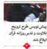
پیش‌نویس طرح ترویج بلاگت و لذت روزانه قرآن ابلاغ شد

سازماندهی: تهران - شماره ۳۳۹ - دوشنبه ۱۴ تیر ۱۳۹۵ - ۱۸ خرداد ۱۳۹۵ - شماره ۱۱۱ - صفحه ۳۶ - ۱۳۹۵