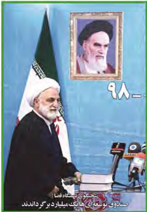
سخنرانی دستگاه قم: صندوق توسعه‌ای ها یک میلیارد برگر دادند