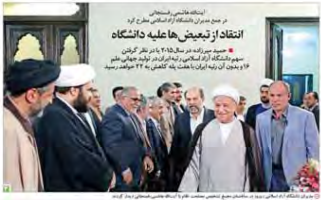
انتقاد از تبعیض‌ها علیه دانشگاه