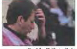
زنجانی در انتظار نتیجه ماند