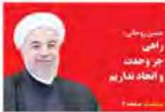
مجلس، رهبری و اتحاد نظامی