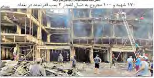
۱۷۰ شهید و ۱۰۰ مجروح به دنبال انفجار ۲ پمپ قدرتمند در بغداد

پرونده ۹۵۰ مدیر نجومی که در جریان انتخابات ریاست‌جمهوری ۱۳۹۲ تشکیل شده، با استعفای چند مدیر به بسته نمی‌شود. این پرونده همچنان در مراجع قضایی در جریان است و منتظر صدور حکم نهایی هستیم.