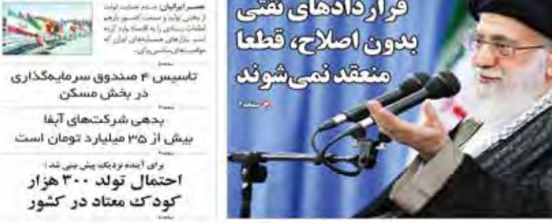
روح‌معلم انقلاب در دیدار با سفیر دانشجویان