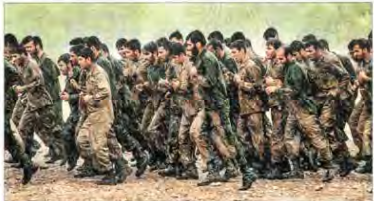
۳۴ سال پس از واقعه ۲۲ بهمن ۱۳۵۷، روزی که ارتش کوراست که در پیوند به جمهوری گشت، اما بعد از گذشت ده سال، همچنان همان ارتش است. در این روزها، ارتش از لحاظ تجهیزات و تجهیزات، از ارتش ایران و عراق است. ارتش ایران در پیوند به جمهوری گشت، اما بعد از گذشت ده سال، همچنان همان ارتش است.