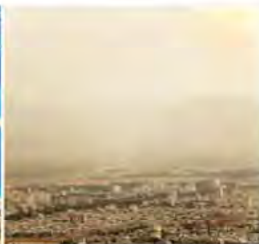
Western governor of Erzurum has been hit by dust storms on June 28, 2016.