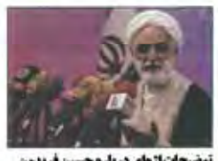
توصیهات از های درباره حسین فریدون