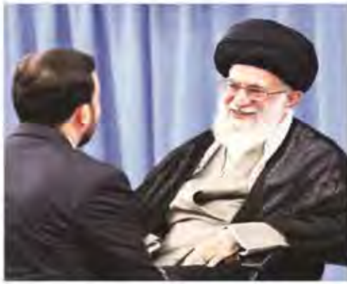
۵ ساعت دیدار دانشجویان با رهبر معظم انقلاب؛ حرف مخالف نظر رهبری جرم نیست

سومین شهردار استعفا داد. این بار هم به‌عنوان فایده‌ساز رسد؟! قصور شهرداری در حادثه شهران، بار دیگر توجه جامعه را به بی‌مسئولیتی مدیران این نهاد جلب کرده است. در حالی که شهرداری موظف است با رعایت استانداردهای ایمنی و بهداشتی، ایمنی شهروندان را تضمین کند، در حادثه شهران، این وظیفه را به‌خوبی انجام نداد. این امر نشان‌دهنده بی‌توجهی و بی‌مسئولیتی مدیران این نهاد است که باید مورد پیگرد قانونی قرار گیرد.