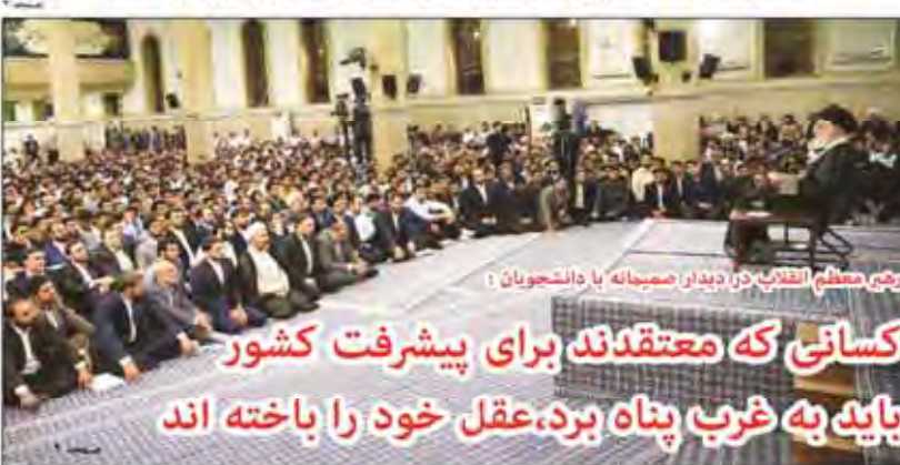
رهبر معظم انقلاب در دیدار صمیمانه با دانشجویان: کسانی که معتقدند برای پیشرفت کشور باید به غرب پناه برد، عقل خود را باخته اند

نامه اردوغان بالاخره کار خود را کرد و روسیه، تحریم‌های خود علیه ترکیه را لغو کرد. اکنون باز هم ترکیه رقیب سرسخت ایران در بازار روسیه است و فرصت طلایی در غیاب این رقیب قدر، باز هم از دست رفت. با نماندن که رجب طیب اردوغان - رئیس‌جمهور ترکیه به ولادیمیر پوتین - رئیس‌جمهور روسیه نوشت، باز دیگر این کشور می‌تواند محصولات تولیدی خود را بدون هیچ محدودیتی روانه بازارهای روسیه کند.