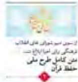
۱۲۰۰۰ اثر فراقوان برای انقلاب زهدی را با املا ابلاغ شد مجلس کامل طرح ملی حفظ قرآن

گزارشی از دیدار ۵ ساعته و صمیمانه امام‌خامنه‌ای با دانشجویان: