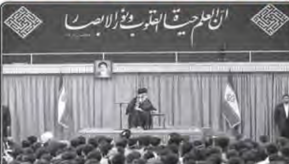
Speaker Khamenei takes notes during a meeting with a group of university students in Tehran, July 2, 2016.

"Those who believe in looking to the West for the progress of the country have lost their minds because mankind will not learn from experience," Ayatollah Khamenei said. The leader further said he has not yet got contracts for international companies will be awarded without necessary criteria. The Iran Parliament's Commission (CPC) is a committee of the country's plan to raise crude production to the pre-sanctions level of four million barrels per day (bpd) and the OPEC member. Khamenei made $200 billion in foreign money to reach its goal. The analysts have said they would not get back to Iran if it made major changes in the long-term contracts in the 1970s, which companies such as France's Total or Italy's Eni had made there in a matter of years in several leases. The former oil contracts has been postponed several times as a sign that they had not been met and they