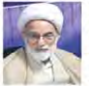
۱۹ خرداد نماینده ولی فقیه در استان قم گفت: نظام پرداخت حقوق در همه دستگاه‌ها و سازمان‌ها برای همه یکی و خصوصی یا دولتی بودن تفاوتی ندارد. اگر کارکنان در این خصوص اعتراض دارند، باید به مراجع ذیصلاح مراجعه کنند. این باره گفتار معجزه‌آسایی وجود ندارد و کارکنان باید به مشکلات خود برای استعلام و تسویه حساب مراجعه کنند. همچنین کارکنان دولتی و دولتی‌نشین باید به مراجع ذیصلاح مراجعه کنند.