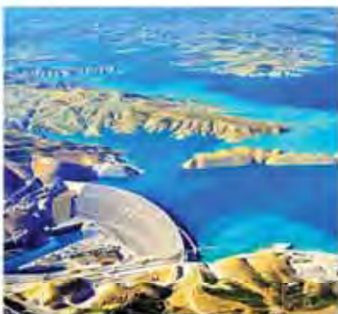
Aerial view of Turkey.

TEHRAN — Activists and scholars have become a victim of various concerns in Turkey. The government has put pressure on them to stop any activities that could harm the environment and the health of the people. The activists are calling for a campaign to save the Mesopotamia area from dust storms.