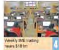
Weekly ISE trading nears $18 bn

Number 5391 • Monday July 4, 2016 • Tr 14, 1395 • Ramadan 28, 1437 • Price 5,000 Rials • 12 Pages • www.irandailyonline.ir