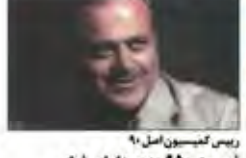
رئیس کمیسیون اصل ۹۰ فهرست ۹۵۰ مدیر دارای فیتی حقوقی نامتعارف تهیه شد