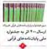
موضوعات و پارادایم‌های فراقوان ارسال ۲۰۰ اثر به جشنواره مجلس پاپانامه‌های قرآنی