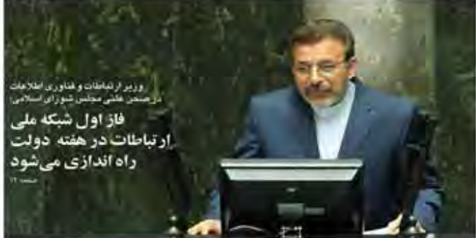
معاون نخست‌زاده و عدل داد

بحران آب در استان تهران با شدت بیشتری ادامه دارد. با توجه به کمبود بارش در فصل بهار و تابستان، منابع آبی استان تهران در حال کاهش است. این وضعیت در صورت ادامه یافتن، می‌تواند منجر به بحران جدی آب در استان تهران در فصل پاییز شود. مسئولان آب و برق استان تهران اعلام کرده‌اند که باید برای مقابله با این بحران، اقدامات فوری انجام داد. این اقدامات شامل کاهش مصرف آب، تعمیرات شبکه آبرسانی و استفاده از منابع آبی جدید است.