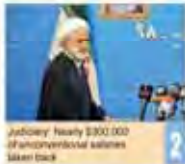
Jadovny heavily struck 2000 Afghan refugees in border strikes