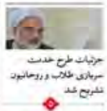
جریانات طرح خدمت سربازان طلاب و روحانیون تشریح شد