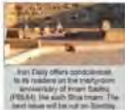
Iran Daily offers condolences to its readers on the tragic anniversary of Imam Sadeq (P.S.A.) the sixth Shia Imam. The lead issue will be out on Sunday.