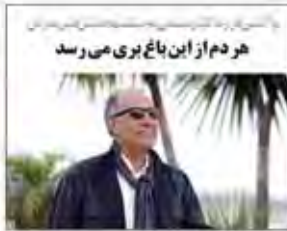
هر دم از این باغ بری می‌رسد