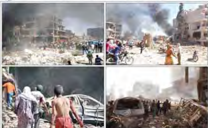
۲۱۴ شهید و زخمی در انفجار انتحاری سوریه

۲۴ درصد شرکت‌های وکالت شده با رشد بازگهی نارایی و ۸۵ درصد با افزایش بهره‌وری نیروی کار همراه بوده است