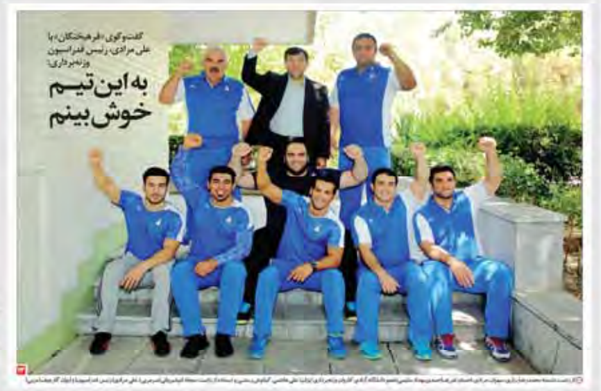
۶۳ قهرمان ایرانی راهی المپیک می‌شوند. در این میان، ۳۳ نفر سهم دانشگاه آزاد اسلامی و ۳۰ نفر سهم سایر دانشگاه‌ها و تیم‌های ملی است.