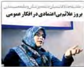
بروز اعلام بی‌اعتمادی در افکار عمومی