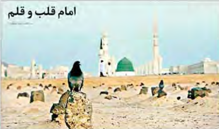
امام قلب و قلم

رئیس هیئت مدیره در رشته فساد بانکی در بی‌انضباطی سیاست‌های پولی و منافع مدیران ایران هراسی دستاویزی برای سرپوش گذاشتن بر جنايات آل سعود صادرات غیر نفتی ۲۱ درصد افزایش یافت