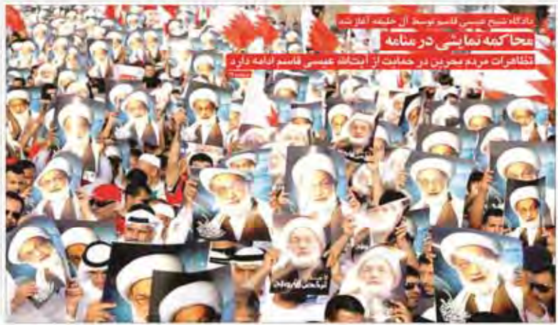
دادگاه شعب عدلیه علیه تیم مذاکره کننده هسته‌ای مخاکمه نمایشی در رسانه تظاهرات مردمی در حمایت از ابتکار عدلیه فاسد ادامه دارد

بعد از برجام تماس‌های ما با کشورهای منطقه زیاد شد