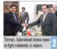
Tehran, Isarabad stress need to fight instability in region

Number 5410 • Tuesday July 28, 2016 • Mordad 7, 1395 • Shahrivar 23, 1437 • Price: 5,000 Rials • 12 Pages • www.irandailyonline.ir