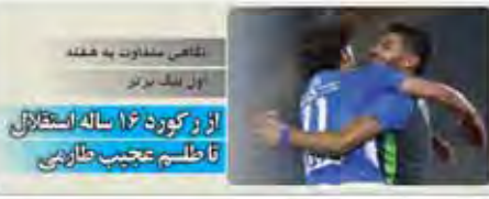
تقاضای متفاوت به هفده اول لیگ برتر از رکورد ۱۶ ساله استقلال تا طلسم عجیب طارمی

پنجشنبه ۷ مرداد ۱۳۹۵ / ۲۳ خرداد ۱۳۹۵ / ۲۸ خرداد ۱۳۹۵ / ۲۹ خرداد ۱۳۹۵ / ۳۰ خرداد ۱۳۹۵ / ۳۱ خرداد ۱۳۹۵ WWW.KHORASANNEWS.COM * KHORASAN - VARZESHI