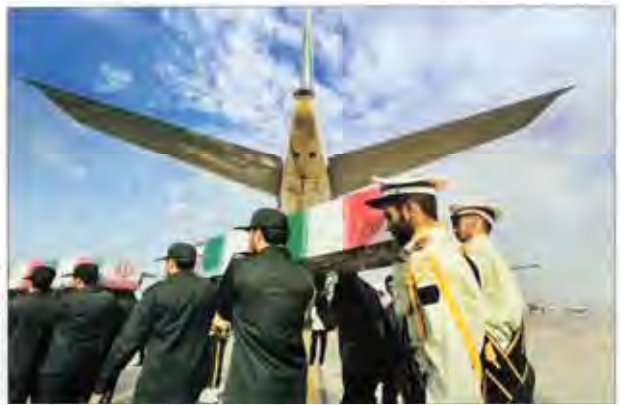
بزرگ‌ترین هواپیمای جهان در تهران فرود آمد. این هواپیمای بوئینگ ۷۴۷-۴۰۰ متعلق به شرکت هواپیمایی ملی ایران است.

رئیس سازمان حفاظت محیط زیست گفت که به خوزستان سفر می‌کنم و به دنبال راه‌های احیای این استان هستم. این استان به دلیل کمبود آب و خشکسالی در حال حاضر با بحران جدی مواجه است.