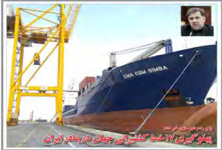
پهلو گیری ۱۷ خط کشمیری اتی جهان در بندر ایران

فروش آب معدنی ۲۰ هزار تونلی فریبخت بزرگترین صادرات غیر نفتی ایران در نیمه اول سال ۱۳۹۵، صادرات غیر نفتی است. این صادرات در نیمه اول سال ۱۳۹۵، ۲۱ درصد افزایش یافته است. این صادرات در نیمه اول سال ۱۳۹۵، ۲۱ درصد افزایش یافته است. این صادرات در نیمه اول سال ۱۳۹۵، ۲۱ درصد افزایش یافته است.