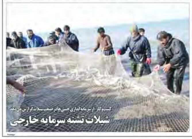
کسب و کار در سرانه گذاری حسن هادی نصیب ستان گران می کند