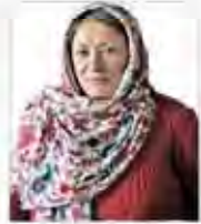
مشیت پرورنده آشامه‌دهنده‌ی هنگام‌ای‌تری

بیژن مغلوبی که در گذشته بی‌سابقه‌ترین حضورش در حلقه‌ی مدافعان حقوق بشر بود، حالا با حضور در شورای نگهبان، به حلقه‌ی مدافعان ننگ می‌شود. او روزی که به مقام خود رسید، به یکباره به عضویت هیئت مدیره‌ی انجمن مدافعان حقوق بشر درآمد. او روزی که به مقام خود رسید، به یکباره به عضویت هیئت مدیره‌ی انجمن مدافعان حقوق بشر درآمد.