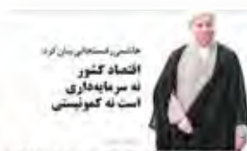
حسنی، دستاوردی برای مردم اتحاد کشور نه سرمایه‌داری است نه کمونیستی