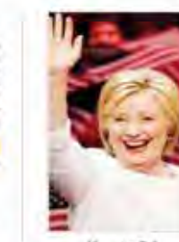
ترک در صف شیشه های قدرن