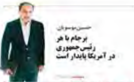
حسن موسویان برجام با هر رئیس‌جمهوری در آمریکا پایدار است

در این کشور به عنوان «پاشنه آشیل» نامیده می‌شوند و به این معناست که اگر این سیاستمداران از بین بروند، دولت روحانی را در این کشور فرو می‌برد. این سیاستمداران در این کشور به عنوان «پاشنه آشیل» نامیده می‌شوند و به این معناست که اگر این سیاستمداران از بین بروند، دولت روحانی را در این کشور فرو می‌برد.