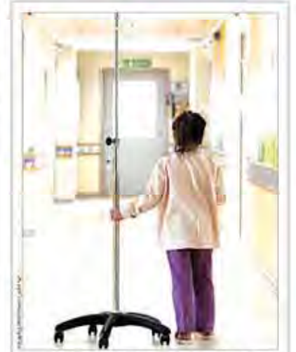
روانشناس قدیمی بیمارستان محکم از تجربه‌هایش می‌گوید

«سختگوی صابره با مواد مخدر در گفت‌وگو با «ششروند» «انگل‌های دانشجویی برای ترک اعتیاد دانشجویان فعال می‌شوند»