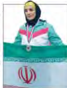
استعاضل رانده سنگوری مبارزه با سختی‌ها و غلبه بر آن‌هاست