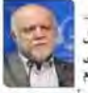
وزیر نعت در مسائل مربوط به ائمتنی هیچ اغماضی نمی‌کنیم