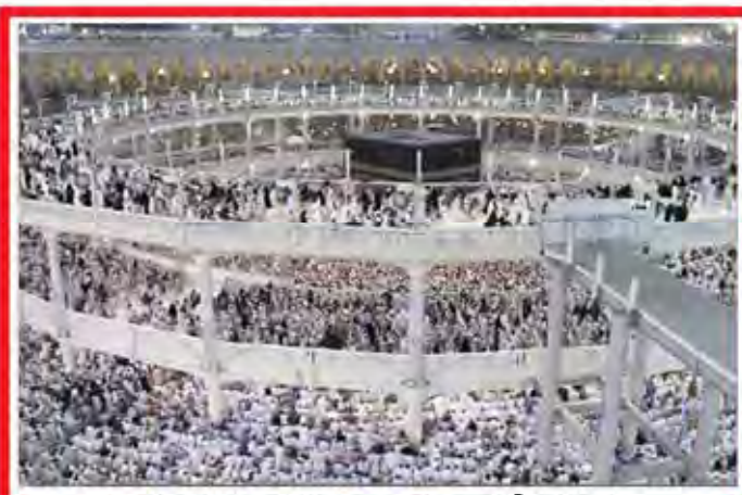
اعزام آزاد برای حج شایعه است ۱/

استاندار ایلام گفت به استخوان ایلام بسیار شبانه شده و این ادارات در این استان کلیتاً بر پایه سیاست بر شده است استاندار ایلام در دیدار با مدیران ادارات استانی در ایلام گفت که بسیاری از ادارات استانی در ایلام در شبانه شدن دچار شده و این ادارات باید در ساعات روز فعالیت کنند و این امر باعث می‌شود که خدمات به مردم بهتر شود استاندار ایلام گفت که این ادارات باید در ساعات روز فعالیت کنند و این امر باعث می‌شود که خدمات به مردم بهتر شود