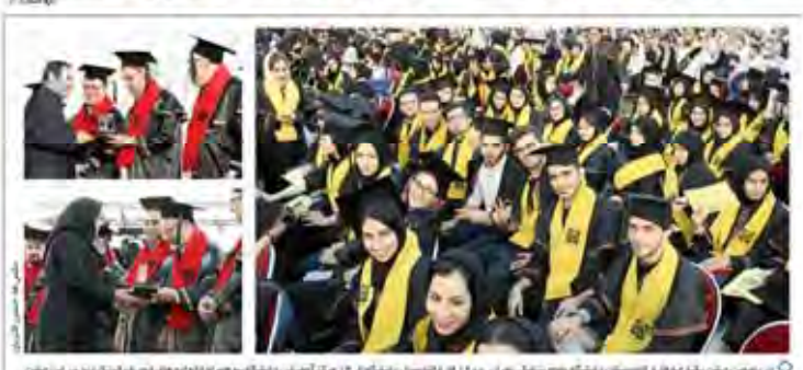
در دومین جشن بزرگ فارغ التحصیلان دانشگاه علوم پزشکی تهران ۱۱۰۰ فارغ التحصیل، دانشگاه از ۱۶ مرکز آموزش و تحقیقات هم در گروه های خود عبارت از دانش دار ایران جشن ۱۶۰۰ شرکت روز و ۱۶۶۰۰ نفر گویا برآورده نامی شد.

بناظرین سوالاتی بطور دائم باید تکوینت روخی شوند