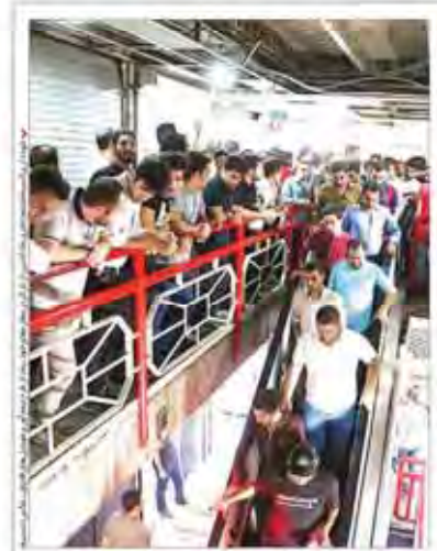
بررسی پیامدهای ۱۵ آبریز کردن تهر به وارشات موبایل در دولت گذشته اقبال یک‌شبه قاچاقچیان

رقم قرارداد بازیکنان و کادرفنی لیگ برتر ۷۸ میلیارد تومان اعلام شد