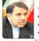
وزیر راه و شهرسازی اولویت بهبود کیفیت زندگی شهری است