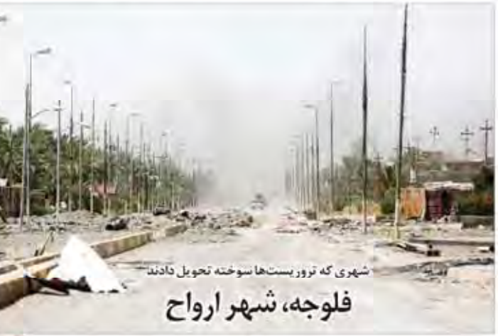
شهری که توو ریست‌ها سوخته تحویل دادند فلوجه، شهر ارواح