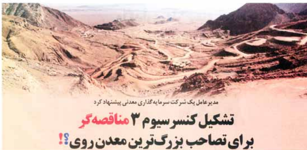
مدیر عامل یک شرکت سرما به گذاری معدنی پیشنهاد کرد