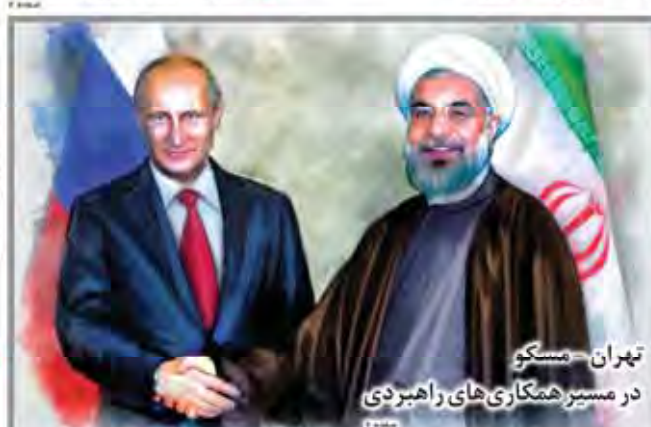
تهران - مسکو در مسیر همکاری های راهبردی