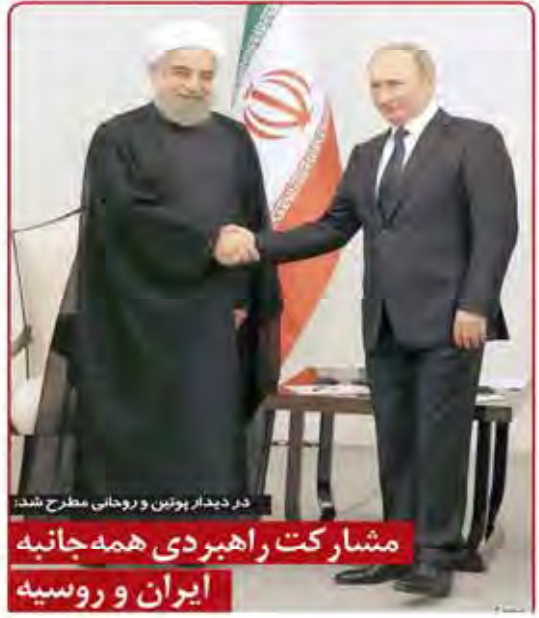
در دیدار پوتین و روحانی مطرح شد: مشارکت راهبردی همه‌جانبه ایران و روسیه

۱۹ خرداد ۱۳۹۵ سید علی خامنه‌ای در بیانیه‌ای که در شبکه‌های اجتماعی منتشر کرد، به توهین به مسئولان و نهادهای کشور اشاره کرد. او نوشت: «توهین به مسئولان و نهادهای کشور جرم است».