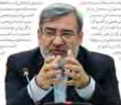
نفت ایران گران‌ترین نفت جهان شد