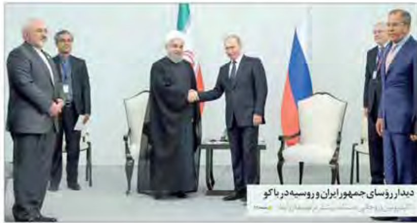
دیدار رؤسای جمهور ایران و روسیه در باکو

بازگشت به تاسیسات هسته ای انفجار ترور بیستی داعش در کویت به پاکستان با ۹۳ کشته و ۱۴۰ زخمی گسب ۲ رتبه برتر روزنامه خراسان در جشنواره سراسری انشا و شهادت معاون استاندار و مدیر ایستگاه مستشفى کربلا جزئیات دستگیری شهروان جزایری در مشهد بازگشت ۲ مجروح به ایران قلیان کشی خونین جوانان کوچه نشین ابو حر در مشهد دستگیر شد