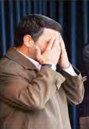
احمدی نژاد اخطار نامی از او بلیا خواست دو میلیارد دلار ایران را آزاد کند نوشدار و بعد از مرگ سهراب!

سرمایه چون همه می باید ایستاد سرمایه چون همه می باید ایستاد سرمایه چون همه می باید ایستاد