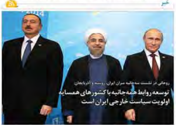
روحانی، کرئیس هیئت مدیره سازمان ایران، روسه و آذربایجان توسعه روابط همه‌جانبه با کشورهای همسایه اولویت سیاست خارجی ایران است

سرمقاله جایگاه کار آفرینی در ایران می‌اندازد آینده روشن‌تری را برای کارآفرینی در ایران می‌بینیم. با توجه به اینکه دولت در حال حاضر به حمایت از کارآفرینان می‌پردازد و قوانین مربوطه را اصلاح کرده است.