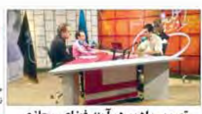
تصویر رادیو در آینه فضای مجازی