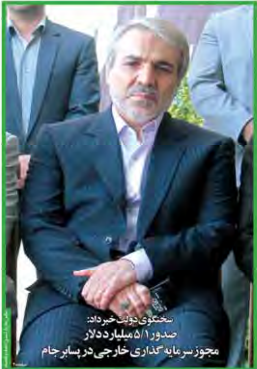
سخنگوی دولت خبر داد: صدور ۵/۱ میلیارد دلار مجوز سرمایه‌گذاری خارجی در پسابر جام