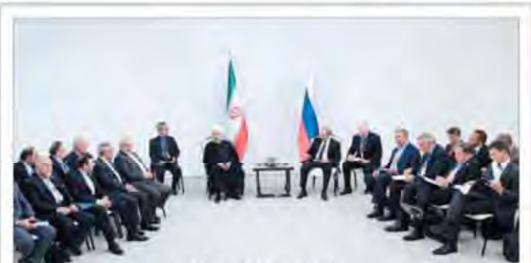
روحانی با پوتین در آذربایجان دیدار کرد

باید درباره برگزاری کنسرت‌ها وحدت رویه در کشور ایجاد کنیم