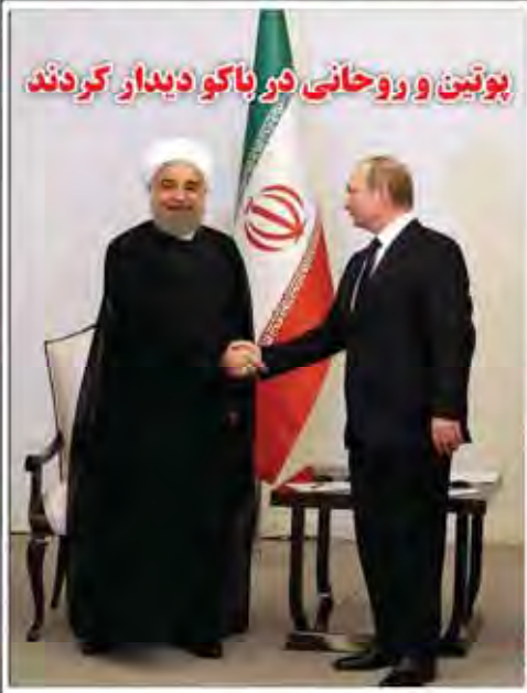
پوتین و روحانی در باکو دیدار کردند

دولت قرار دادهای جدید نفتی را ابلاغ کرد!