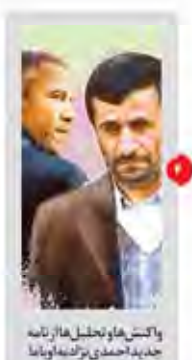
واکنش های تحلیلی ها از نامه جدید احمدی نژاد به او ایاندا

بازگشت به تاسیسات هسته ای انفجار ترور بیستی داعش در کویت به پاکستان با ۹۳ کشته و ۱۴۰ زخمی گسب ۲ رتبه برتر روزنامه خراسان در جشنواره سراسری انشا و شهادت معاون استاندار و مدیر ایستگاه مستشفى کربلا جزئیات دستگیری شهروان جزایری در مشهد بازگشت ۲ مجروح به ایران قلیان کشی خونین جوانان کوچه نشین ابو حر در مشهد دستگیر شد