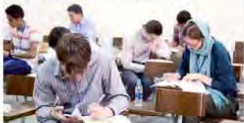
دانشجویان در کلاس درس در یکی از دانشگاه‌های ایران. در تصویر بالا، دانشجویان در حال مطالعه و بحث در کلاس درس هستند.