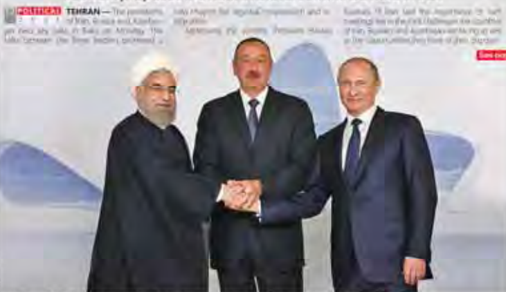
President Hassan Rouhani (L), Russian President Vladimir Putin (C) and President Ilham Aliyev (R) shake hands after signing a joint declaration on regional integration in Baku on Monday.

Rouhani proposes the next trilateral summit be held in Iran