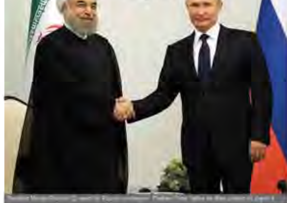
Iran, Russia and Azerbaijan explored cooperation on joint economic projects and regional security issues in a trilateral summit in the Azeri capital Baku on Monday.