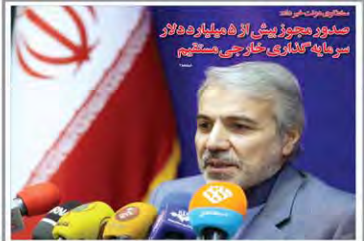
مستقری دولت خبر داد صدور مجوز پیش از ۵ میلیارد دلار سر مایه گذاری خارجی مستقیم

سخن ایران در واژه نور و یادمان ایران آریایان فرستور گشت سخن که با این سخن آریایان ایران را به یادمان آریایان فرستور گشت سخن که با این سخن آریایان ایران را به یادمان آریایان فرستور گشت