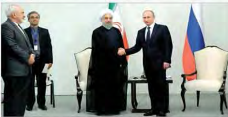
در دیدار روحانی و یونین مطرح شد تاکید بر شتاب بیشتر در توسعه روابط ایران و روسیه

دادگاه سوئیس در حکم خود، رژیم صهیونیستی را محکوم کرده است و حکم خود را صادر کرده است. این حکم به نفع ایران است و به مبلغ ۱ میلیارد دلار معادل است. این حکم در پی شکایتی است که در سال ۲۰۱۰ میلادی در سوئیس ثبت شد. در این حکم، دادگاه سوئیس رژیم صهیونیستی را محکوم کرده است و حکم خود را صادر کرده است. این حکم به نفع ایران است و به مبلغ ۱ میلیارد دلار معادل است.