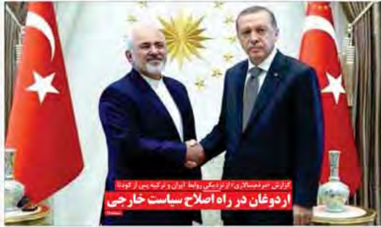
گزارش مردم سالاری از اردوی تابستانی ایران در ترکیه پس از کودتا اردوغان در راه اصلاح سیاست خارجی