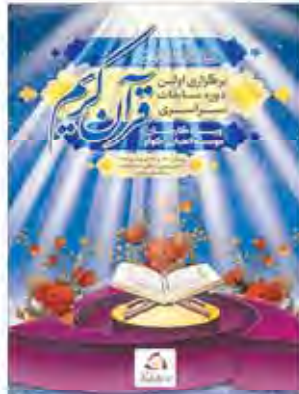
به این که در ۱۰ سال گذشته، حزب محکمان برگزار شده بود این مسابقات به عنوان مسابقات دکتر رضایی مدیرعامل مجلس...