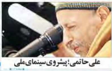
علی حاتمی: پیشروی سینمای ملی

روزنامه فرهنگی - اجتماعی صبح ایران - ۴ صفحه شماره ۱۳۹۵ - ۱۳۹۵ - ۱۳۹۵ - ۱۳۹۵ - ۱۳۹۵ www.jamejamonline.ir