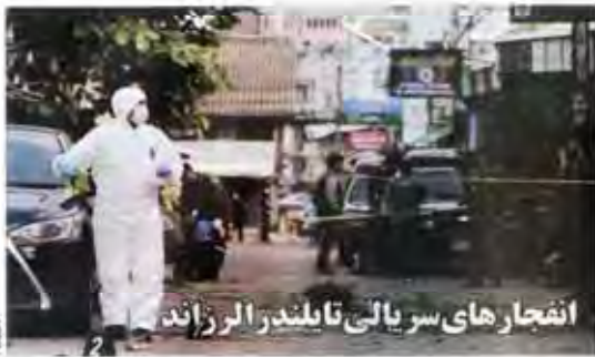
انفجارهای سریالی تایلند را زلزله لرزاند