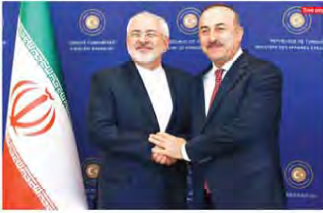
Zarif made the remarks during a press conference with his Russian counterpart Sergei Lavrov in Ankara.

TEHRAN — As the Iranian army is fighting the Islamic militant in the northern province of Nizwa, Iran's Foreign Minister Mohammad Javad Zarif said on Friday that Iran, Russia and Turkey, as three key powerbrokers, should engage in dialogue to combat with regional challenges.