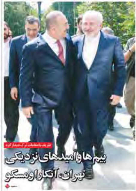
نظر: با اطلاعات تکمیلی کرد