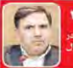
تکامل آورده دولت در آزادراه تهران شمال