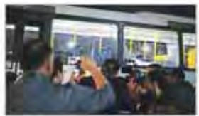
خستگی شدن تهدید تورپیستی در حاشیه المپیک ریو

ضعف بانک‌ها در تسهیلات‌دهی به بخش مسکن. گزارش‌ها نشان می‌دهد که بانک‌ها در تخصیص اعتبار برای مسکن دچار کمبود هستند.