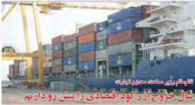
تأمین گاز برای صنایع مسکن و کشاورزی