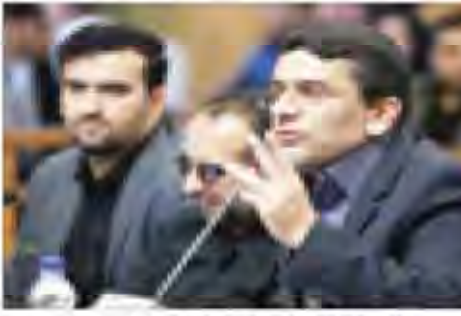
حفاظت از آمارهای غیر واقعی شهادت ایران ایجاد کرد

در این بخش، نویسنده به پیش نویس بیاتیه روسیه در باره سوریه اشاره می کند.