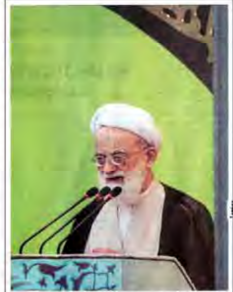
دنیای اسلام با پول آل سعود بده خطر افتاده است