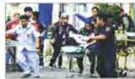
وقوع انفجارهای زنجیره‌ای در تایلند