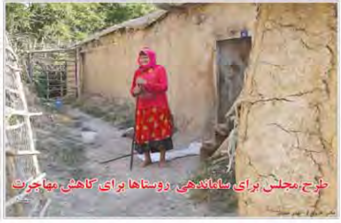
طرح مجلس برای ساماندهی روستاها برای کاهش مهاجرت