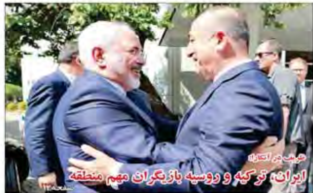
عزیز در انتظار ایران، ترکیه و روسیه بازیگران مهم منطقه