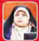
ازاده جدی دولت برای حفاظت از محیط زیست