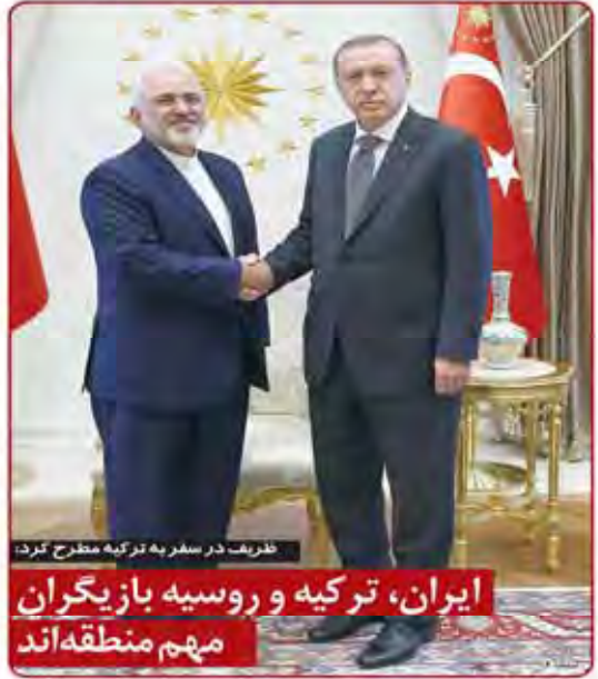
ظریف در سفر به ترکیه به ترکیه مطرح کرد: ایران، ترکیه و روسیه بازیگران مهم منطقه‌اند

۱۹ دی منتظری در سخنرانی مطبوعاتی در مشهد گفت: من هیچ گروهی را تهدید نمی‌کنم و هیچ گروهی را تهدید نمی‌کنم. من هیچ گروهی را تهدید نمی‌کنم و هیچ گروهی را تهدید نمی‌کنم.