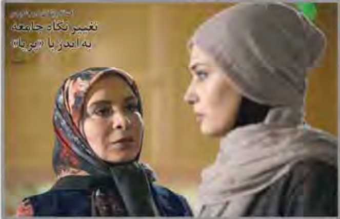
تعبیر نگاه جامعه به اندرز با «بهرجا»