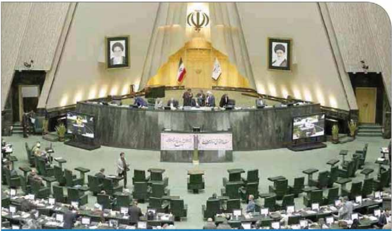
کتابخانه آرسناله قبل

قانونی مختلفی در گینه انجام شده است. در زمینه مدیریت کشور، کشورداری، ارتش و امنیت و... اصلاحاتی انجام و باعث شده تا زمینه مساعدی برای کشور ایجاد شود. به طور مثال حاصل این اصلاحات بخشیدگی دو سوم از بدهی‌های گینه بود.