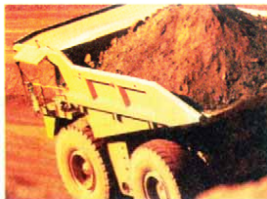
Commodity prices are recovering.

However, with regard to the slump in the commodities market, the outlook is expected to improve.