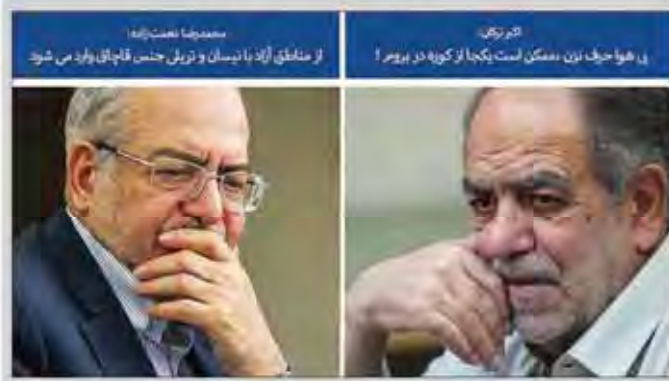
تجزیه و تحلیل: از مناطق آزاد با نسیان و تزیین جنس قاچاق وارد می‌شود. در هوا حریف نون نسیان است یکجا از کوزه در بریزد!