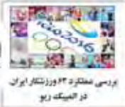
اگرسی عملکرد ۲۲ وزیر نظام ایران در آئینک ریو