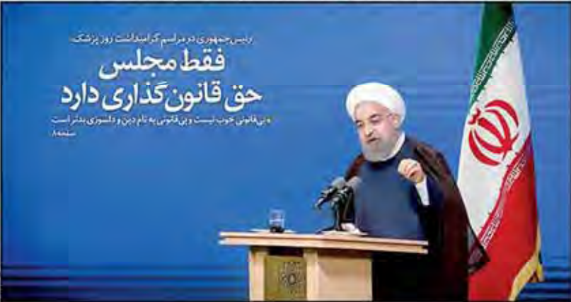
رئیس هیئت مدیره بانک ملی در مراسم گردهمایی روز پزشک فقط مجلس حق قانون گذاری دارد