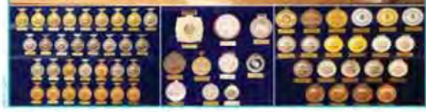
توکيو بدون توقف

پوشش آتش‌نشانی، نامتعارف، شبکه صنعت، فرماندهی است... رؤیای ملکه شدن با مانتوهای ۱۵ هزار تومانی!