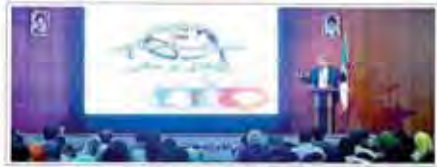
دبیر کل حزب مردم سالاری در مراسم گرامیداشت روز پزشک سلامت هر جامعه در گرو سلامت زمامداران آن است گزارش مردم سالاری از نتیجه تحقیق و تفحص بنیاد شهید که گمان می‌شود