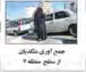
جمع اوری ملکدان از مناطق مختلف ۲