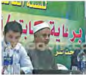
مركزی، سجده، دور مسابقه حفظ قرآن و تحلیل از ۹۷ حافظ