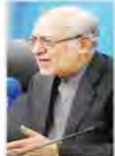
جذب ۱/۵ میلیارد دلار سرمایه خارجی در ۶ ماه گذشته