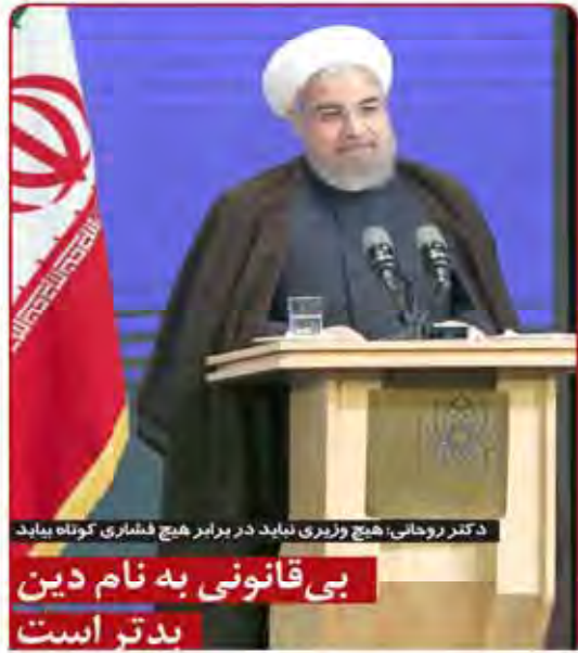
دکتر روحانی، هیچ وزیری نباید در برابر هیچ فشاری کوتاه بیاید بی قانونی به نام دین بدتر است

۱۹ دی، سازمان امور خارجه ایران اعلام کرد که استفاده روسیه از پایگاه هوایی همدان برای حملات به تروریست‌ها در سوریه منسوخ شده است.