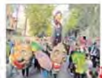
سازمان هواپیمایی نیروی هوایی ارتش

شماره ۵۷۳ - پیاپی ۱۸۹۲ - ۲۲ صفحه - قیمت ۱۰۰۰ تومان عروسک‌های صلح طلب در تهران