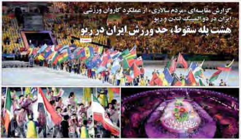
گزارش مقایسه‌ای «مردم سالاری» از عملکرد کاروان ورزشی ایران در دو المپیک لندن و ریو هشت پله سقوط، حد ورزش ایران در ریو

رئیس جمهور: بی قانونی به نام دین بدتر است