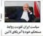
سیاست ایران تقویت روابط مستحکم خود با آمریکا را دنبال