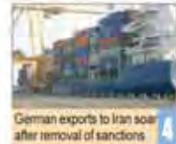
German exports to Iran soar after removal of sanctions

Number: 5431 • Tuesday August 23, 2016 • Shahrivar: 2, 1395 • Dhu al-Qadah 20, 1437 • Price: 5,000 Rials • 12 Pages • www.irandailyonline.ir