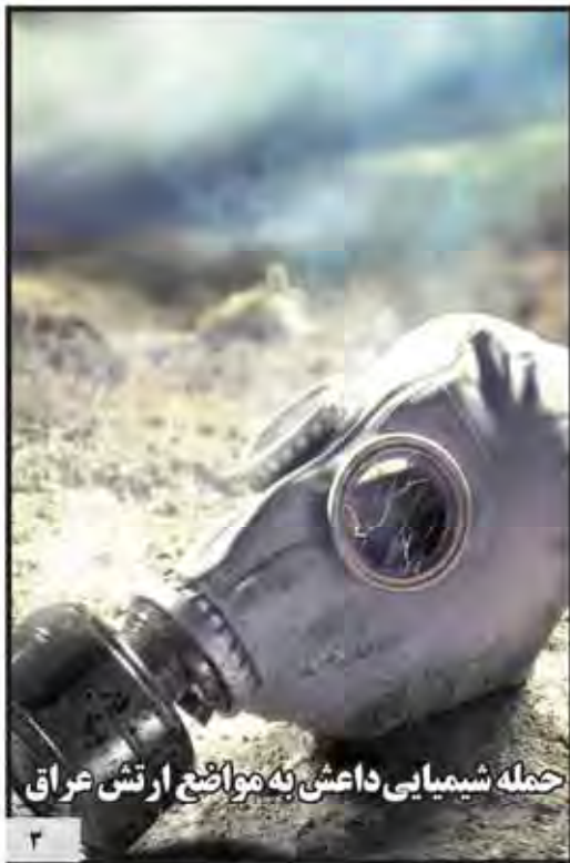
حمله شیمیایی داعش به مواضع ارتش عراق

سازمانی وزارت خارجه در باره دستگیری بر غیر از مسئولان با دلیل دو بخشی بودن شرکت در نوژه هیچ مسئولی را نام نبرد. دیگر بود است. وزارت خارجه در نشست خبری در پاسخ به سوالاتی همسایه به سوالاتی در باره شرکت در نوژه اظهار داشتند: «ما در این باره هیچ اظهار نظر خاصی نداریم». اما در باره شرکت در نوژه، وزارت خارجه در نشست خبری در پاسخ به سوالاتی همسایه به سوالاتی در باره شرکت در نوژه اظهار داشتند: «ما در این باره هیچ اظهار نظر خاصی نداریم».