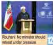
Rouhani: No minister should retreat under pressure