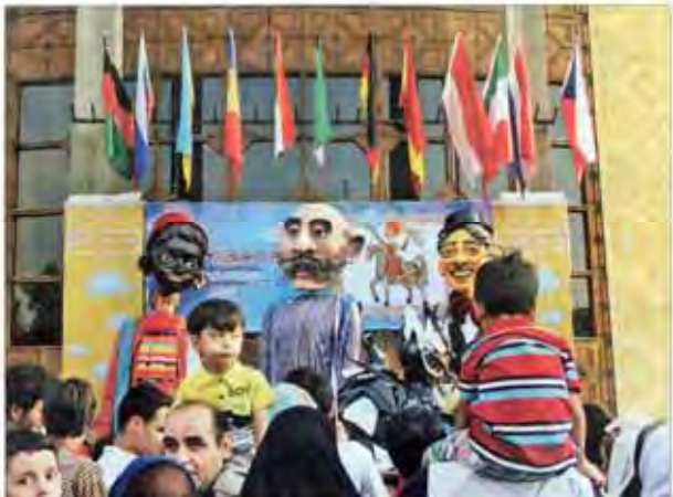
شهر در دست عروسک‌ها | جشنواره تئاتر عروسکی با حضور عروسک‌های کوچک و بزرگ آغاز به کار کرد.

آرمی‌پول گند که انتظار به پایان رسیده است. آرمی‌پول گند که انتظار به پایان رسیده است.