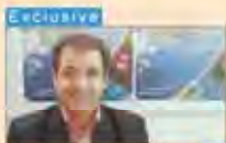
Hospital infections lower in Iran than in other developing countries