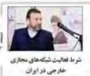
تردد فعالیت شبکه های مجازی خارجی در ایران