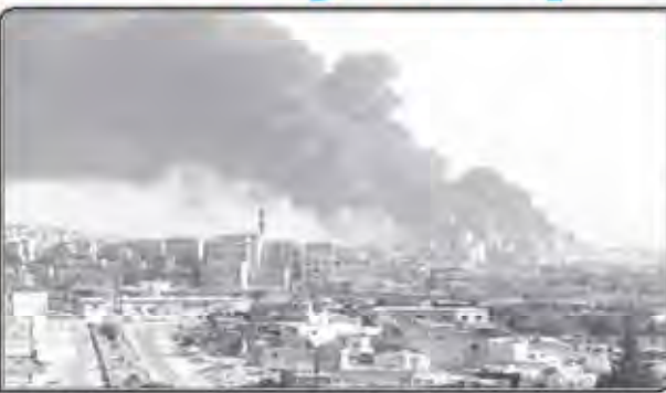
Smoke rises following a Russian airstrike on a militant-controlled cement plant in southeast Aleppo on Aug. 8, 2016.

on Monday dismantled these operations, while equally rebuffing Moscow for publicizing the move describing it as showing off and opportunistic. "We have not given any military force to the Russians and they are not here to stay," Dehqan said, in apparent reaction to the critics who had called the move a breach of Iran's constitution, which forbids "the establishment of any kind of foreign military base in Iran, even for peaceful purposes." The Iranian, he said, "also has a desire to show themselves in the reflection of the theater of operations in Syria, in order to be able to cooperate with the Americans and guarantee themselves a stake in Syria's political future." He said there was "no common agreement" between the two countries and the "operational cooperation" was temporary and limited to military. Iran's Foreign Ministry spokesman Bahram Ghassemlou said these steps