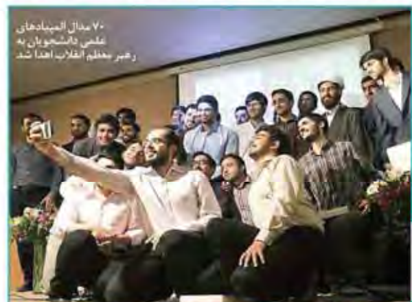
۷۰۰ مدال المپیادها علمی دانشجویان به رهبر معظم انقلاب اهدا شد