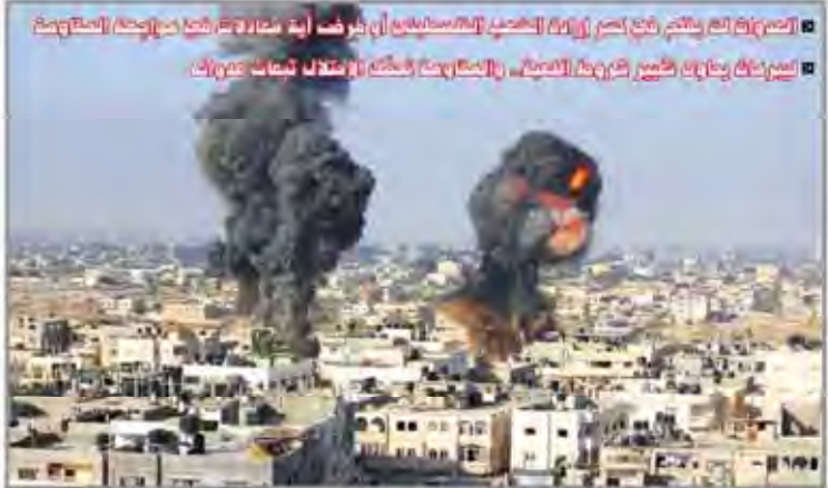
الحملة العنصرية التي شنها الجيش الإسرائيلي في غزة ضد (حملة مدامات) والحملة العنصرية التي شنها الجيش الإسرائيلي في شمال غزة

حزب الله لبنان أعلن تأييده للفصائل الفلسطينية في وجه العدوان الصهيوني. القصف المكثف الذي شنته القوات الإسرائيلية على شمال قطاع غزة، أسفر عن مقتل 11 شخصاً بينهم 5 أطفال و6 نساء، وإصابة 40 شخصاً آخرين بجروح خطيرة. كما داهمت قوات الاحتلال بالضفة الغربية 10 منازل في بلدة بيتونيا، مما أسفر عن مقتل 3 أشخاص وإصابة 15 آخرين بجروح. هذه الهجمات تأتي في إطار سلسلة من العمليات العنصرية التي يشنها الجيش الإسرائيلي منذ بداية العام، بهدف القضاء على المقاومة الفلسطينية.