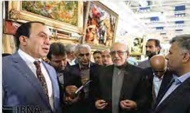
وزیر اقتصاد، حسن و کبیرزاد در خصوص انعقاد قرارداد با شرکت توسعه و توسعه انرژی در زمینه تولید برق در استان آذربایجان غربی با حضور استاندار و مدیران محلی در تبریز. در تصویر: وزیر اقتصاد، حسن و کبیرزاد، استاندار آذربایجان غربی، محمد باقر نوبخت، مدیران محلی و اعضای هیئت مدیره شرکت توسعه و توسعه انرژی.