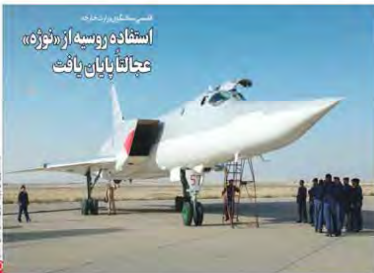
سازمان هواپیمایی نیروی هوایی ارتش

استفاده روسیه از «نورث» عجالتاً پایان یافت