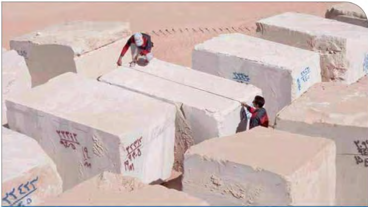
نگاره از صفحه قبل

میلیون تنی یا ۲ واحد هزار و ۵۰۰ میلیون تنی ذوب آهن از وزارت صنعت، معدن و تجارت داده شده که براساس رایزنی های انجام شده این مهم در دستور کار قرار گرفته که امید است تا پایان کار دولت یازدهم به سرانجام برسد.