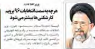
مقام معظم رهبری

هر چه سمت انتخابات ۹۶ برویم کارشکنی‌ها بیشتر می‌شود هر چه سمت انتخابات ۹۶ برویم کارشکنی‌ها بیشتر می‌شود. این عبارت به معنای افزایش موانع برای برگزاری انتخابات است.