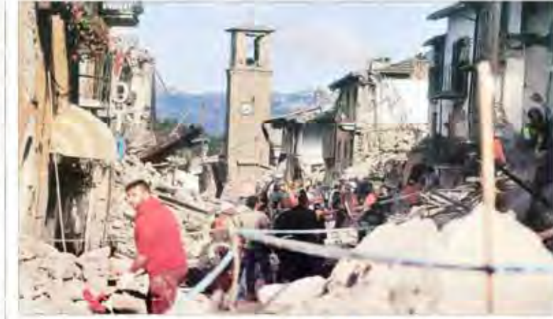
زلزله مرگبار در اروپا و آسیا | جنس سازه‌های بتن‌ساز شده زلزله‌یاد نیست. ۴۰ درصد بنگلادش، ژاپن، کره و مالتی پس از زلزله‌های یازدهم می‌آید، بخش مهمی از مهندسی‌کنندگان و معماران اروپا و آسیا

رئیس سازمان جنگل‌ها از جنگل‌های هیرکانی عنوان کرد ۱۰۰ هکتار جنگل هرگز در جنوب استانی نمی‌ماند