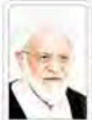
مقام معظم رهبری

موج تازه فشارها علیه شیعیان در پاکستان و افغانستان آغاز شده است. این فشارها منجر به کشته شدن ده‌ها نفر شده است.