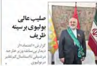
کزارش «اعتقاد» از فرماندهای منطقه ویژه خراسان در تشریح نامگذاری گنبد گلبرگ در بولیوی

حسین سرتیله، وزیر نفت، در مراسم افتتاح پروژه توسعه میدان نفتی «رامی» در استان خراسان جنوبی، گفت: ما در این منطقه سرمایه گذاری نمی‌کنیم و اگر لازم باشد نامشان را می‌گویم.