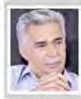
محمدرضا بهرامن رئیس خانه معدن ایران

یکی از کلیدی‌ترین پرسش‌هایی که امروز در سطح جامعه به‌ویژه میان تخبگان کشور مطرح می‌شود این است که چرا با گذشت چند ماه از اجرایی شدن برجام اتفاق خاصی در اقتصاد ایران رخ نداده است. در پاسخ می‌توان پرسید که اگر برجام به سرانجام نمی‌رسید چه