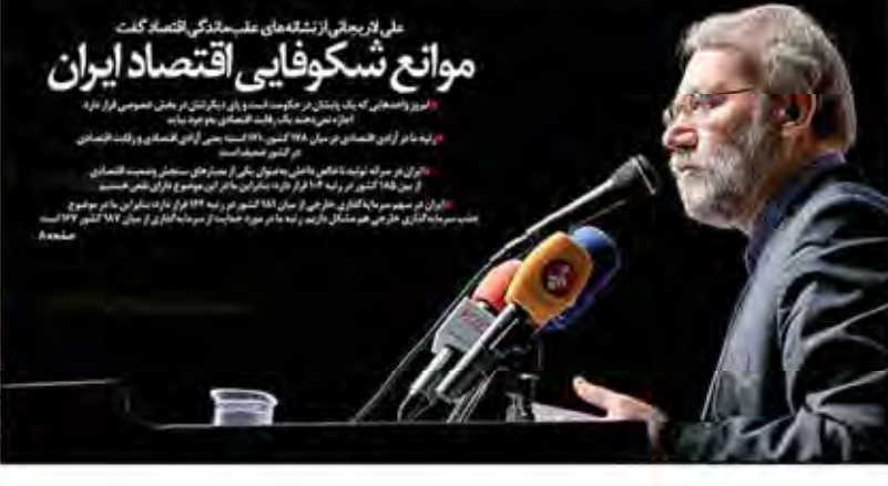
علی لاریجانی از نشانه های عقب ماندگی اقتصاد گفت