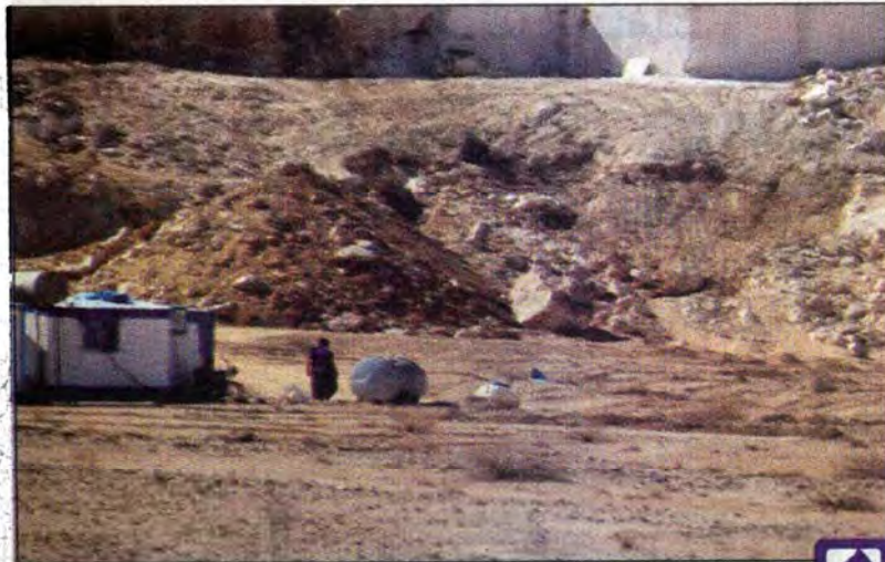
دهانه غار جهنم به این روز افتاده است.