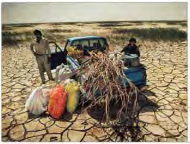
هامون: دریای گردوغبار | رئیس سازمان جنگل‌ها و مراتع کشور، یک هفته از کانال‌های گردوغبار در استان سیستان و بلوچستان فعال است