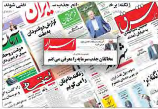
این مجله در ماه‌های اخیر به دلیل انتقادات فراوان از سوی مسئولان دولتی و نظامی، به بستن دهان منتقدان پرداخته است. در این تصویر، چند صفحه از مجله دیده می‌شود که حاوی گزارش‌های انتقادی و مطالبی است که به نظر می‌رسد هدف از انتشار آن، بستن دهان منتقدان بوده است.

در روز جمعه به جای پاسخ به سوالات جدی درباره قراردادهای نفتی، مدیران این وزارتخانه به بستن دهان منتقدان پرداخته است. در این تصویر، چند صفحه از مجله دیده می‌شود که حاوی گزارش‌های انتقادی و مطالبی است که به نظر می‌رسد هدف از انتشار آن، بستن دهان منتقدان بوده است.