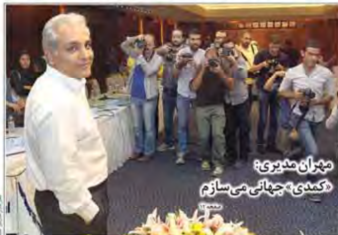
مهران مدیری: «کمدی» جهانی می سازم

سهیم نوشتن افزاز اسلامی - ایرانی در بازار نوشتن مجموعات وارداتی فقط ۱۰ درصد اعلام شده است