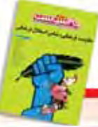
مقاومت فرهنگی شامن استقلال فرهنگی