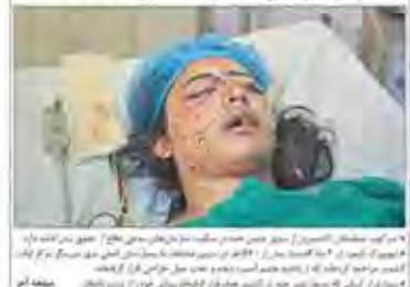
تنگنای ساختمانی اتریش هند و جسم‌هایی که در کسمیر ناپیدا شد