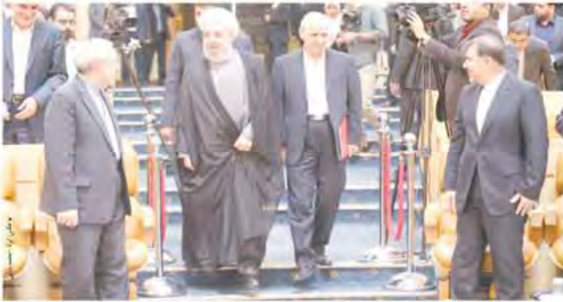
احتمال تکرار انقلابی تکرار کننده در اتاق بازرگانی برگزاری انتخابات تک نامزدی در پارلمان بخش خصوصی