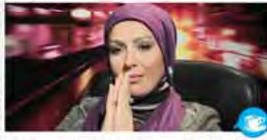
بازیگر نقش فرح: ملکه‌ها خوشبخت نیستند

جام جم از تبلیغات گسترده سوداگران جدایی در فضای مجازی گزارش می دهد