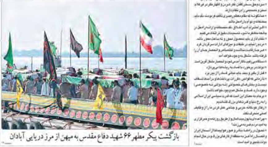
بازگشت پیکر مطهر ۶۶ شهید دفاع مقدس به میهن از مرز دریایی آبادان

رئیس‌جمهوری با اشاره به رویکرد دولت در تصمیم‌گیری، افزود: «ما به دنبال منافع ملی هستیم و در عرصه بین‌المللی، به دنبال حل و فصل مشکلات روزمره و توسعه آینده کشور است.»