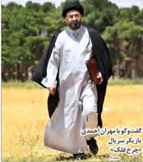
گفت‌وگو با مهران احمدی بازیگر سریال «جرخ فلک»

تبلیغات طلاق آسان و نفیستی سبب کاهش فریب این آسیب شده است کانون و کار با باند برای مدیریت تبلیغات روحی از واکاوی به طلاق ساز و کار مناسب ایجاد کند