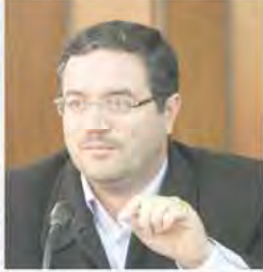
فالم نظام وزیر صنعت، معدن و تجارت پیش‌بینی کرد: جهش ۱۰ میلیارد دلاری صادرات غیر نفتی سال ۹۵

۲ پشتیبان در واکنش به اظهارات سخنگوی قوه قضائیه: دولت از هیچ مختلفی دفاع نمی‌کند