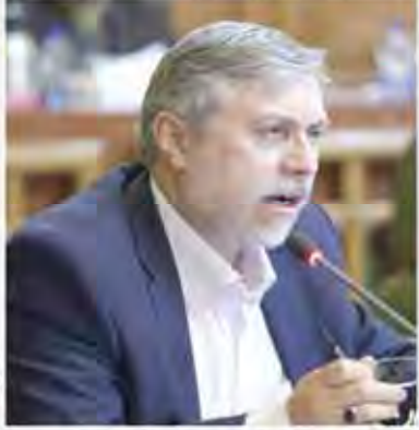
ولیعظم سیف در جریان همایش بانکداری اسلامی در تهران. وی با اشاره به چالش‌های موجود در صنعت بانکداری اسلامی، اظهار داشت که یکی از مهم‌ترین موانع برای توسعه این صنعت، کمبود سرمایه‌های بلندمدت است.

آسیب شناسی مزاحمه کسرت مسئول بانک مرکزی در نشست تخصصی بانکداری اسلامی در تهران، با اشاره به چالش‌های موجود در صنعت بانکداری اسلامی، اظهار داشت که یکی از مهم‌ترین موانع برای توسعه این صنعت، کمبود سرمایه‌های بلندمدت است. وی افزود که برای رفع این موانع، نیاز به اصلاحات قانونی و ایجاد یک چارچوب حقوقی مناسب است.