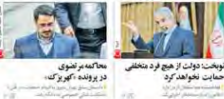
محاکمه عزتضوی در پرونده «کهریزک» محاکمه عزتضوی در پرونده «کهریزک»

بانک مرکزی، پرداخت وام به کارکنان بانک‌ها از منابع فرض الحسنة ممنوع شد