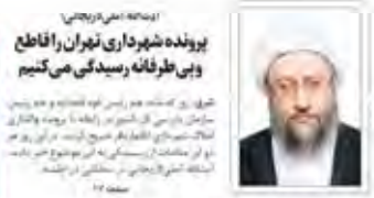
پرونده شهرداری تهران را فاطح و بی طرفانه رسیدگی می‌کنیم

یک درسد برای پژوهش و فناوری توسعه فناوری و پژوهش در کشور نیازمند سرمایه‌گذاری است. دولت باید سهم بیشتری در این زمینه داشته باشد.