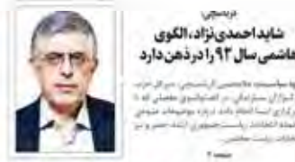
شاهب احمدی نژاد، الگوی هاشمی سال ۹۳ را در ذهن دارد

سازمان اطلاعات و امنیت ملی آمریکا اعلام کرد که سیا به دلیل نگرانی از نفوذ گروه‌های تروریستی، اقدام به دستکاری شاخص بورس تهران کرده است.