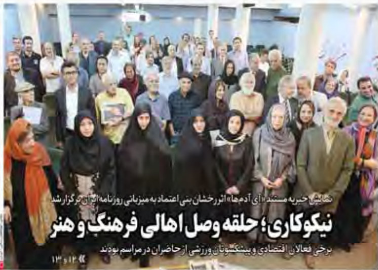
کتابش خبریه مستند «آی آدجا» اثر رخشان بنی اعتماد به میزبانی روزنامه ایران برگزار شد نیکوکاری؛ حلقه وصل اهالی فرهنگ و هنر برخی فعالان اقتصادی و پیشگویان ورزشی از حاضران در مراسم بودند

معاون وزیر اقتصاد با «ایران» به گفت و گو نشست