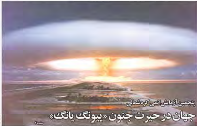
جهان در حیرت جنون «پیونگ یانگ»