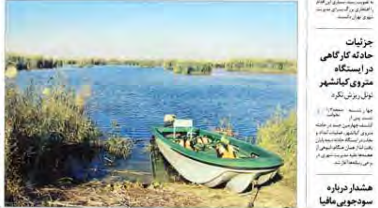
ناهماهنگی دستگاه های دولتی، عامل بحران خشکی هورالعظیم شرکت نفت با مسدود کردن دهانه آوری آت به هورالعظیم بحران گردوغبار را تشدید کرد

گزارش سازمان هواشناسی کشور از بارش باران در ۸ استان در استان های تهران، البرز، قزوین، زنجان، اصفهان، قم، سمنان و گیلان بارش باران رخ داد