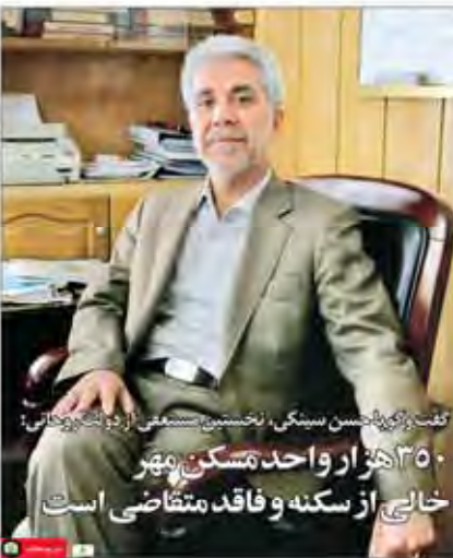
تفت زنگی با حسن سینگی، نخستین سنجی از زلزله خانی: ۳۵۰ هزار واحد مسکن مهر خانی از سکنه و فاقد متقاضی است

برگ تیرین آزمایش هسته‌ای تاریخ پیونگ یانگ، موجب زمین لرزهای شریقی در شمال کره و زلزله‌های سیاسی در جهان شد