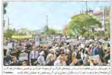
نمایندگان نمازگزاران در راهپیمایی نمازگزاران جمعه سراسر کشور در تهران. شعارها علیه آل سعود و آل خلیفه در جریان راهپیمایی بود.

محکومیت جنایات آل سعود و آل خلیفه در راهپیمایی نمازگزاران جمعه سراسر کشور