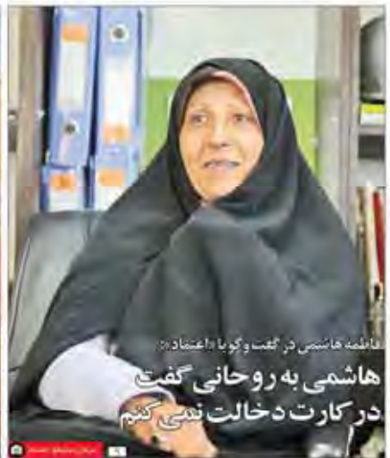
فاطمه هاشمی در گفتگو با اعتقاد: هاشمی به روحانی گفت در کارت دخالت نمی‌کنیم

تو در تویی نهادی و نقد قوه مجریه در ادامه به بررسی عملکرد قوه مجریه در راستای اجرای سیاست‌های کلان کشور می‌پردازیم. در این بخش به بررسی عملکرد دولت در زمینه‌های مختلف از جمله اقتصاد، سیاست خارجی و مسائل اجتماعی می‌پردازیم. کارزار جهانی و فدریت جهانی در گزارشی از انتشاره آلمانی می‌خوانیم که بحران‌های زیرومیعی در شهر بی دفاع دشت طلا با «ساره جوانمردی» افراد باارزشی که در این دشت طلا و به نظر می‌آید بر اساس اعتقاد درگیری نظامی با امریکادر خلیج فارس بعید است خبرگزاری آسوسی در گزارشی می‌نویسد که درگیری نظامی با امریکادر خلیج فارس بعید است.