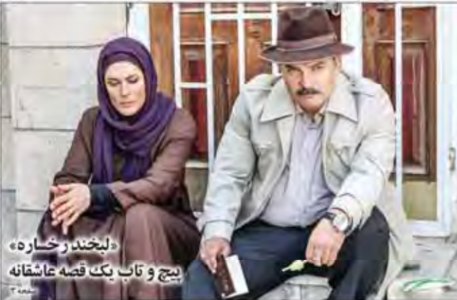
«ببخند و خساره» بیج و تاب یک قصه عاشقانه

مجلس نمایندگان آمریکای طرح شکایت خانواده قربانیان ۱۱ سپتامبر از عربستان را تصویب کرد