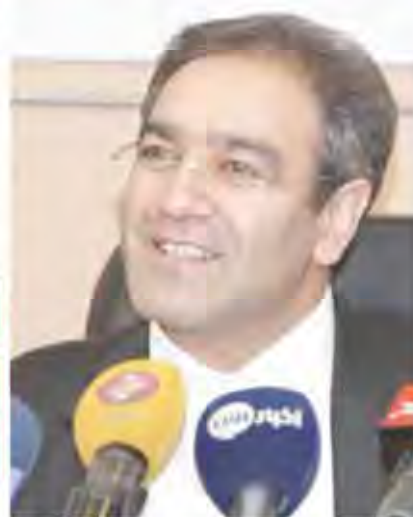
تایب رئیس اتحادیه صنف فروشندگان لاستیک و روغن، پتیرگیان و فیروزسازان تهران: رقابت محصولات قاچاق و تولیدات بی کیفیت برای تخریب تولید داخلی

انزو سبکتان روز جمعه ۱۹ شهریور ۱۳۹۵ در گفت‌وگو با جهان اقتصاد، رئیس سازمان بورس و اوراق بهادار ایران، در خصوص اقدامات انجام شده در راستای پیوستن به FATF و لزوم اجرای قانون مبارزه با پولشویی گفت: این اقدام برای برجام و توسعه اقتصاد ایران حیاتی است. ما در پی اجرای قانون مبارزه با پولشویی هستیم. این قانون در سال ۱۳۹۳ تصویب شد و ما در حال اجرای آن هستیم. ما در پی اجرای قانون مبارزه با پولشویی هستیم. این قانون در سال ۱۳۹۳ تصویب شد و ما در حال اجرای آن هستیم.