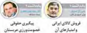
فروش کالای ایرانی و امتیازهای آن

تولید کالاهای ایرانی با استفاده از محصولات شهیدان و کسب و کارهای مرتبط با آنها، می‌تواند یکی از راه‌های موثر برای افزایش آبروی کوچه‌های شهر باشد. این اقدامات علاوه بر حمایت از تولید داخلی، باعث یادآوری خاطرات شهدا و تقویت روحیه ملی‌گرای شهروندان نیز می‌گردد.