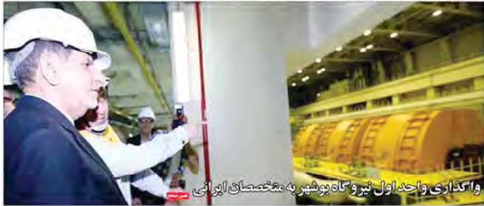
واگذاری واحد اول نیروگاه بوشهر به متخصصان ایرانی

پوستن کرمان به گروه ویژه اقدام مشترک (G7+1) بر ادامه تحریم کرمان نظیر سایر استانها و پانزدهمین نشست که در سال ۱۹۶۱ شورای مجلس صنایع معدنی صورت گرفته است. همچنین کرمان به گروه ویژه اقدام مشترک (G7+1) بر ادامه تحریم کرمان نظیر سایر استانها و پانزدهمین نشست که در سال ۱۹۶۱ شورای مجلس صنایع معدنی صورت گرفته است.