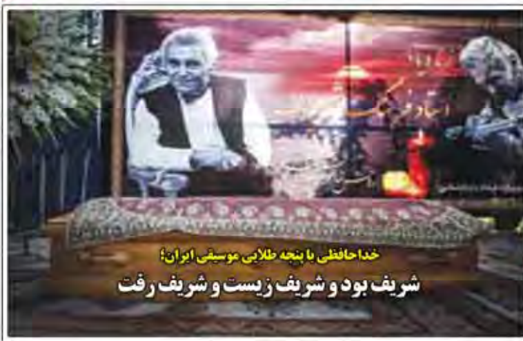
خدا حافظی با پنجه طلایی موسیقی ایران! شریف بود و شریف زیست و شریف رفت

فرستاده و تهدیدها عده عدم تصدیق در حوزه بهداشت و درمان خاطرهای فرهنگی و شرعی