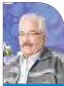
کوچک را بخرند.

روبه‌رو می‌شوند. ما اکنون خریدار سنگ آهن از بخش خصوصی آن هم به قیمت روز هستیم. وی افزود: خام‌فروشی سنگ آهن درست نیست زیرا کشوری مانند چین گینه کوناکری حتی اجازه صادرات بوکسیت خود را به تنهایی نمی‌دهد. واحدهایی همچون گل‌گهر یا چادرملو می‌توانند سنگ آهن واحدهای