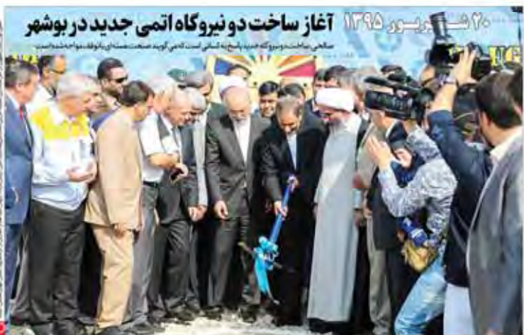
آغاز ساخت دویزگاه اتمی جدید در بوشهر ۲۶ شهریور ۱۳۹۵ سازمان انرژی اتمی با حضور استاندار بوشهر و مدیران ارشد سازمان انرژی اتمی، مراسم آغاز ساخت دویزگاه اتمی جدید در بوشهر برگزار شد.