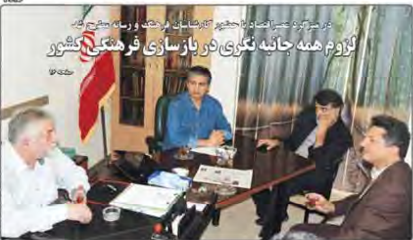
در مرکز کرد عصر اقتصاد با حضور آقایان فرهنگت و رسانه مطرح کرد گروم همه جانبه نگر در بازسازی فرهنگی کشور

غارت انسان ها به نام صنایع دستی به نام صنایع دستی رئیس اداره فرعی صنایع دستی و تجارت استان قرنیز از قائمیه ۱۰۰ هزار نفر بازرگانی در استان صنایع دستی و صنایع کوچک صنعتی استان را فرهنگی صنایع دستی و گردشگری برآمد حاصل از فروش صنایع دستی آبی ۹۰۰ میلیارد ۲ میلیون دار اقدام می کند به نام صنایع دستی رئیس اداره فرعی صنایع دستی و تجارت استان قرنیز از قائمیه ۱۰۰ هزار نفر بازرگانی در استان صنایع دستی و صنایع کوچک صنعتی استان را فرهنگی صنایع دستی و گردشگری برآمد حاصل از فروش صنایع دستی آبی ۹۰۰ میلیارد ۲ میلیون دار اقدام می کند