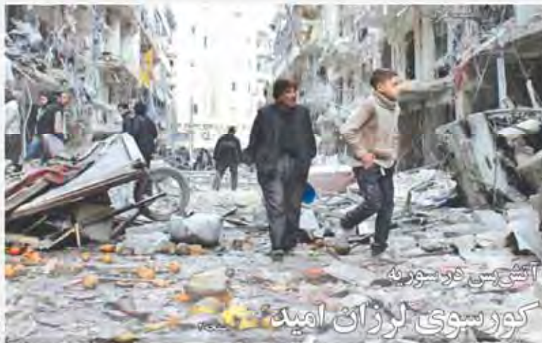
آتش‌سوزی در سوریه کورسوی لرزان امید