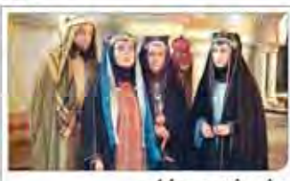
موسیقی متن، فراموش شده جذاب