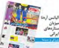
الیاس ارنا ستاره‌های ایرانی