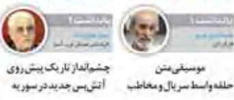
چشم‌انداز تاریک پیش‌روی آتش‌بس جدید در سوریه

تفصیلاتی که در خصوص خوابگاه‌های دانشجویی در تهران و سایر شهرها به دست آمده است، نشان می‌دهد که این خوابگاه‌ها به دلیل کمبود امکانات و نبود سرویس‌های مناسب، نتوانسته‌اند به نیازهای دانشجویان پاسخ دهند. این خوابگاه‌ها علاوه بر کمبود امکانات، با مشکلات دیگری نیز مواجه هستند که باعث شده است دانشجویان به جای خوابگاه‌ها، در مکان‌های غیرمجاز و نامناسب اقامت کنند.