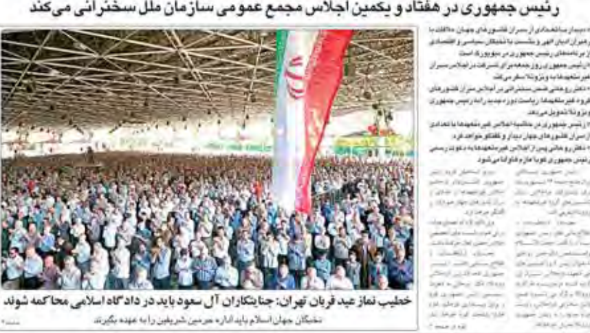
خطیب نماز عید قربان تهران: جناحکاران آل سعود باید در دادگاه اسلامی محاکمه شوند

صالحی: هیچ توافق محرمانه‌ای میان ایران و ۵+۱ نبوده است رئیس سازمان انرژی اتمی ایران اعلام کرد که هیچ توافق محرمانه‌ای بین ایران و گروه ۵+۱ وجود ندارد. وی افزود که ایران در مذاکرات خود، هیچ چیز را پنهان نکرده است و تمام اطلاعات مربوط به برنامه هسته‌ای خود را در اختیار گروه ۵+۱ قرار داده است.