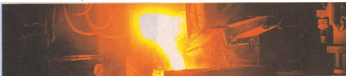
Iran's largest steelmaker Mobarakeh Steel Company accounted for 30% of the overall domestic crude steel output during the first five months of the current Iranian year (started March 20).

He also announced plans to boost its subsidiary company, Saba Steel Complex's crude steel manufacturing capacity