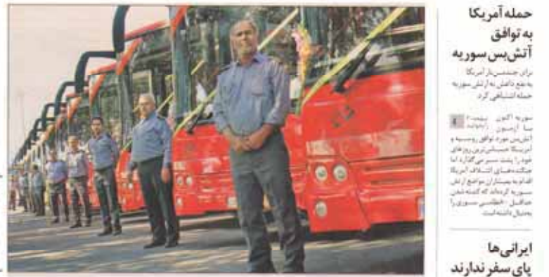
قالیباف: به جای حرف زدن کار کنیم

نیاید اجازه داد که روحیه انقلابی با میل و دل بستن به دنیا و وارد شدن در مسابقه تحمل برستی و اسراف تضعیف شود