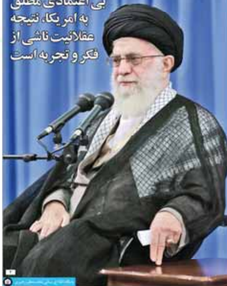
فرماندهای سپاه پاسداران انقلاب اسلامی