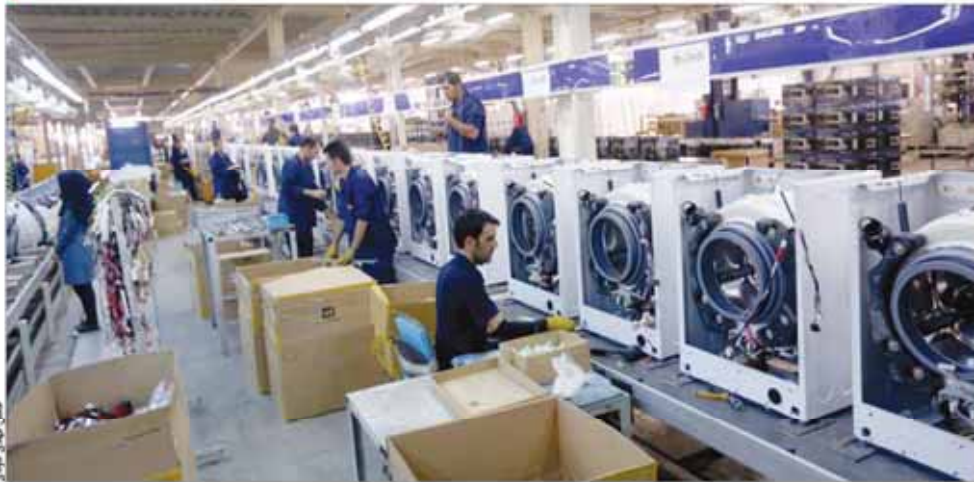
صنعت معدن تجارت