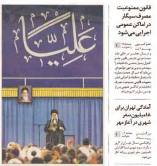
به آینده خوشبینم جوانان مؤمن و آماده مجاهدت فر اوآند رهبر معظم انقلاب کسی که از بی‌تعالی زبانه‌خوایی می‌کند مایه هیهب شیعه است

قالبیاف: افرادی که کم کاری کردند امروز قضاوت‌های غیر منصفانه می‌کنند امروز قضاوت‌های غیر منصفانه می‌کنند. این سخن را علی قالیباف در جلسه ۱۲۷۲ در ۲۹ شهریور ۹۵، بیان کرد.