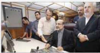
افتتاح شبکه های تلویزیونی «شما» و «امید»