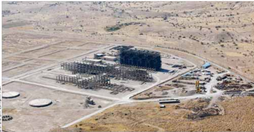
شهرک صنعتی باساج تکمیل می‌شود