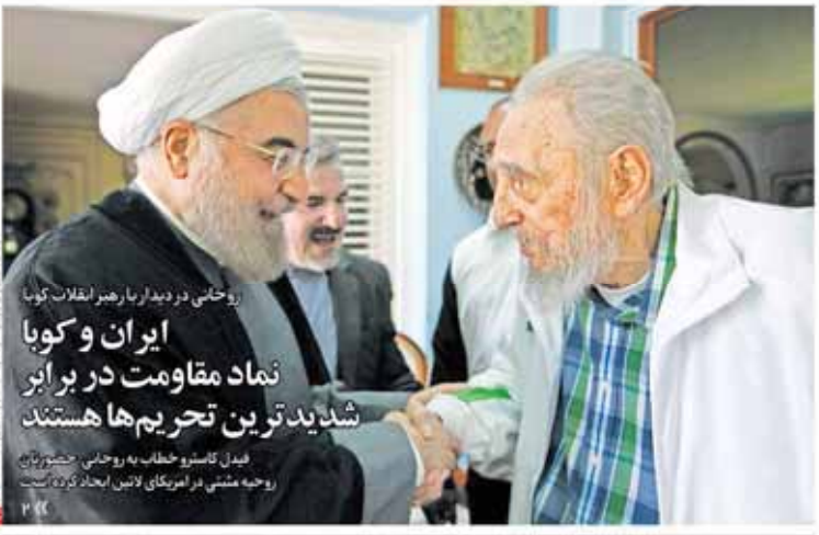
روحانی در دیدار با رهبر انقلاب کوبا ایران و کوبا نماد مقاومت در برابر شدیدترین تحریم‌ها هستند فیصل کاشیرو خطاب به روحانی: جشنواره روحیه پیشانی در امریکای لاتین ایجاد کرده است

سال بنیاد و ۵۰۳ شماره ۳۳۱۵ چهارشنبه ۳۱ شهریور ۱۳۹۵ ۱۱ خرداد ۱۳۳۷ ۲۴ خرداد ساز انتشارات مکان تهران و کابل ۵۰۰ تومان www.iran-newspaper.com ۲۱ Sep 2016 No. 3315