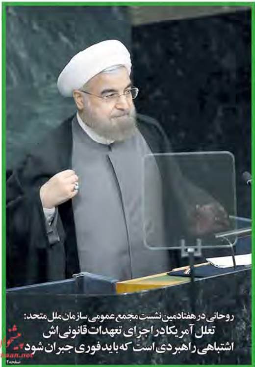
روحانی در هفتادمین نشست مجمع عمومی سازمان ملل متحد: تملل آمریکادر اجرای تعهدات قانونی اش اشتباهی راهبردی است که باید فوری جبران شود

شماره ۳ مهر ۱۳۹۵ ۲۲ دی‌ماه ۱۳۹۴ ۲۲ سپتامبر ۲۰۱۶ سال چهاردهم، شماره ۳۵۲۲ صفحه ۱۲ تومان ۱۰۰۰