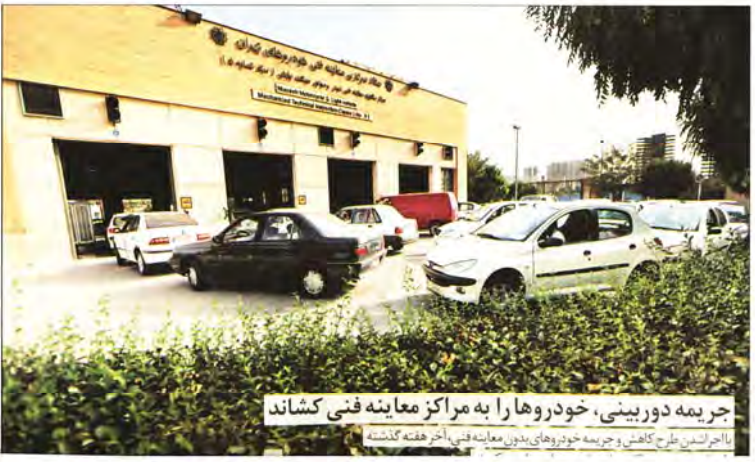
جریمه دوربینی، خودروها را به مراکز معاینه فنی کشاند با احداث طرح کاهش و جریمه خودروهای بدون معاینه فنی، آخر هفته گذشته

برای جبران تعلل سه‌ساله در اجرای قانون مبارزه با قاچاق و شناسه‌دار نکردن کالاها، حالا اصناف ۲ هفته فرصت دارند تا برای اجناس خود اسنادی فراهم کنند که اصالت آن را نشان دهد