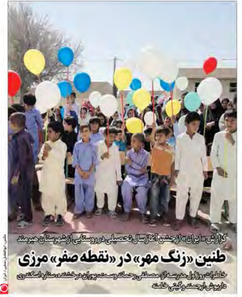
کاروانسرای ایران، از جشن آغاز سال تحصیلی در روزگاری از شهرستان خرمشهر طنین «زنگ مهر» در «نقطه صفر» مرزی خطرات روزگار را در «نقطه صفر» مرزی خرمشهر و سراسر مرزها و استان خرمشهر در چشمه و گیتی خفته