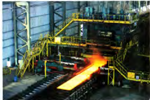
KSC is the largest semis producer in Iran.

With KSC's large-scale capacity expansion plans to produce 5 million tons per year from the current 3.5 million tons by the yearend, outsourcing consulting can help the producer meet the targets. The company plans