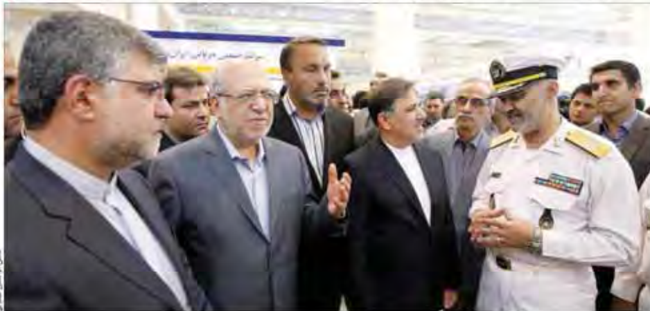
مجلس با اعتماد کسب کرد

ورود ایران به تولید داروهای گران خودروهای جدید در دستور کار «ایکاپ»