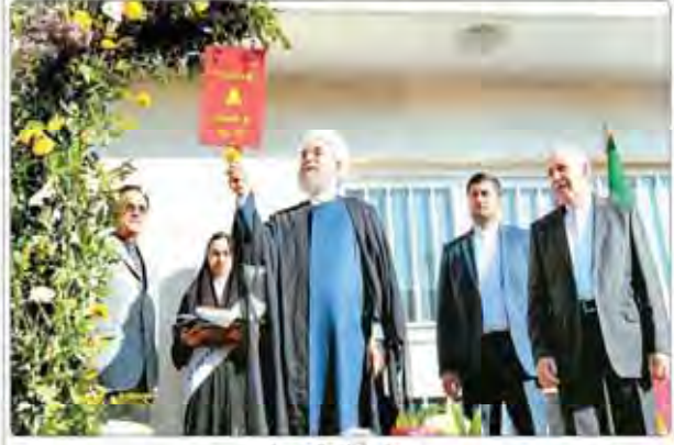
در مراسم آغاز سال تحصیلی رئیس جمهوری: اخلاق، تدبیر و اعتدال باید در مدارس حاکم شود

«باید همتی استقامتی ملی و روحیه همکارانه در حل مشکلات مردم ایجاد شود» «تجارت همه جانبه در طول چند سال و از سوی همبستگی از توان دفاعی» «برخی از کشورها در منطقه دچار تنش‌های امنیتی شده‌اند» «باید در راه یافتن راه‌های مشترک دست زد» «امکان است برخی از کشورها هوس‌های بی‌بافت و باز در منطقه و به دور ریختن امنیتی داشته باشند اما ما مسئولان باید به وجه همکارانه این اقبال شویم» «رئیس‌جمهوری اسلامی» «باید که تمام تلاش‌ها را در جهت حل مشکلات مردم بکنیم» «کاهش نرخ تورم» «کاهش نرخ تورم» «کاهش نرخ تورم» «کاهش نرخ تورم» ظریف: آمریکا ابوابی‌ها را از معامله با ایران منصرف می‌کند «وزیر خارجه از تلاش‌های دولت امریکایی در منصرف کردن امریکایی‌ها از معامله با ایران منصرف می‌کند» «امروزه تقویت می‌دهد و ایران از بر داد و ستد منصفانه می‌تواند» «توجه به این امر که در سوره بقره و سوره آل عمران» «نماد استقامت خداوند»