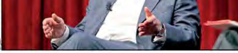
ظریف: آمریکا نباید مانع تعامل ایران با بقیه جهان شود