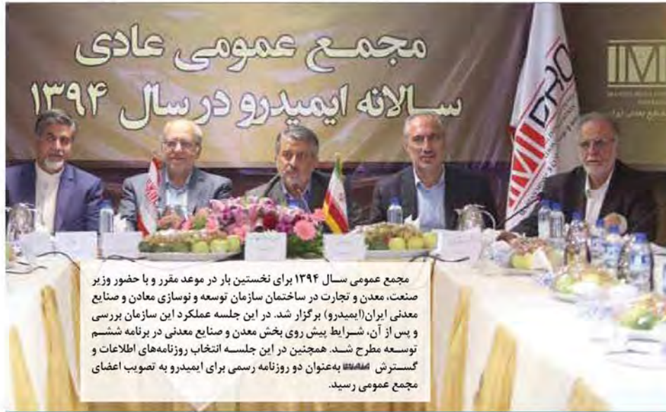
مجمع عمومی سال ۱۳۹۴ برای نخستین بار در موعد مقرر و با حضور وزیر صنعت، معدن و تجارت در ساختمان سازمان توسعه و نوسازی معادن و صنایع معدنی ایران (ایמידرو) برگزار شد. در این جلسه عملکرد این سازمان بررسی و پس از آن، شرایط پیش روی بخش معدن و صنایع معدنی در برنامه ششم توسعه مطرح شد. همچنین در این جلسه انتخاب روزنامه‌های اطلاعات و گسترش به‌عنوان دو روزنامه رسمی برای ایמידرو به تصویب اعضای مجمع عمومی رسید.