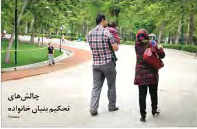
چالش های تحکیم بنیان خانواده