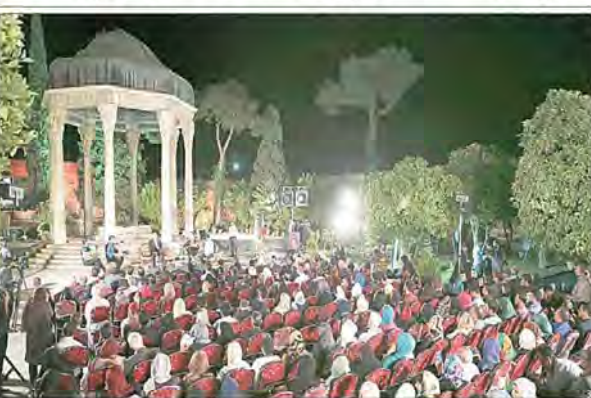
بزرگداشت یادروز حافظ در میعادگاه عاشقان شعر و ادب

رأی‌زنی‌های بیژن زنگنه در الجزایر به کوتاه آمدن عربستان انجامید