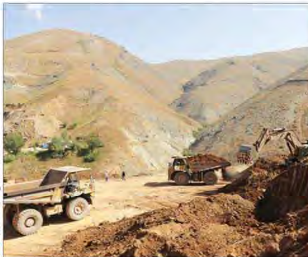
صمیمیت‌های فرصت امروز

به گفته شکوهی، هم‌اکنون در «جنگل‌های نایبگا» (واقع در مناطق