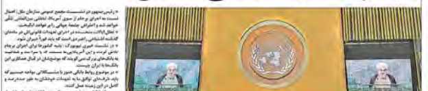
۷ ماه پس از روز اجرای برجام