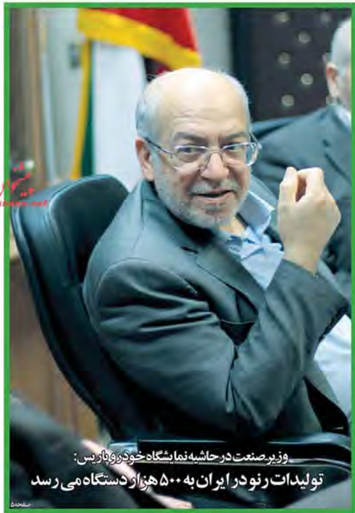
قدرتانی امامی کاشانی از رهبران انقلاب

شماره ۱۰ مهر ۱۳۹۵ مهر ۱۳۹۵ ۲۹ سپتامبر ۲۰۱۶ سال چهاردهم، شماره ۲۵۲۹ صفحه ۱۲ تومان ۱۰۰۰