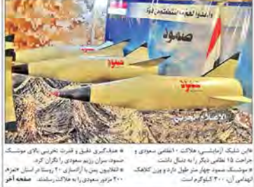
انصار الله موشک جدید خود را با شلیک به پایگاه نظامی عربستان آزمایش کرد

عدهای تصور می‌کنند با وعده دیگران مملکت آباد می‌شود