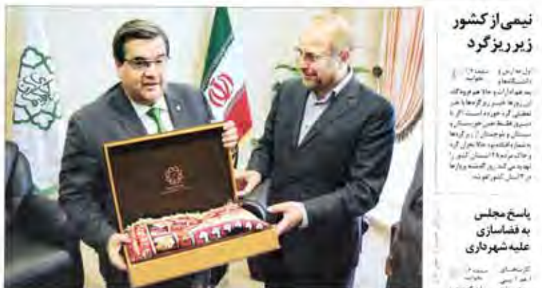
تمجید شهردار مونترال از دستاوردهای شهرداری تهران شهردار مونترال و رئیس شورای شهر تهران در این سفر از فعالیت‌های مؤثر شهرداری تهران بازدید کردند

بازار مسکن فعلاً رونق نمی‌گیرد از این پس بازار مسکن رونق نمی‌گیرد