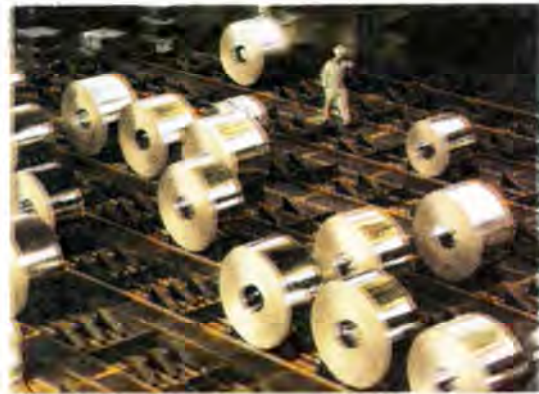
Mills with high inventories have no option but to reduce their prices.

Company sold small batches of material through the IME at 14.50 million rials ($407) per ton ex-stock, on 55 days' delivery.