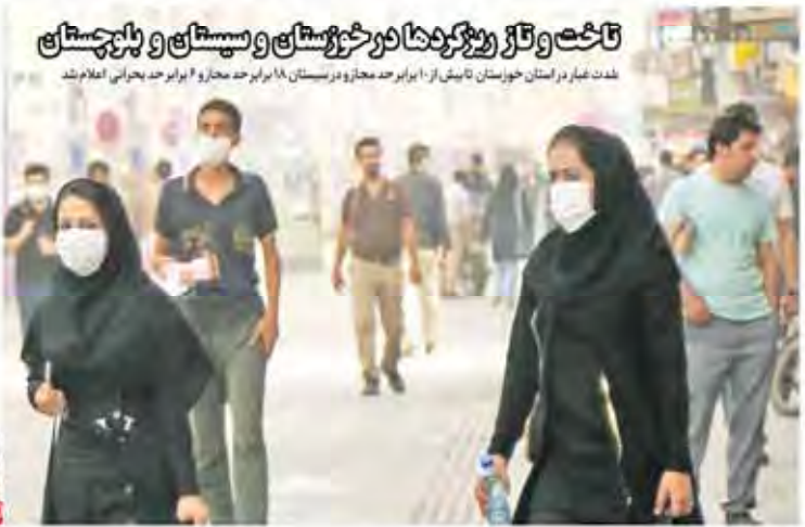
تاکت و تکرار و تکرار در کلاس و سبک و پارسایان شدت مبارز در استان خوزستان تا بیش از ۱۰ برابر حد مجاز و در سیستان ۸۸ برابر حد مجاز و ۶ برابر حد بحرانی اعلام شد پاسخ به ابهامات موسس نوابی خوزینی جزئیات تولید مدل های جدید «رنو» در ایران زانو لغو کنید بازی فوتبال ایران و کره جنوبی ابزار دعوی سیاسی تکنیک موسیقی را

سال ۱۳۹۵ و شماره ۱۳۳۶ روزنامه: ۱۳ مهر ۱۳۹۵ شماره: ۱ صفحه: ۲۶ پخش: ۳۰۰ استان تهران و آذربایجان شماره: ۰۰ تلفن: ۰۰ ۳۰۰۰ ۳۰۰۰ ۳۰۰۰