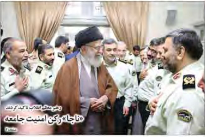
رهبر معظم انقلاب تاکید کرد: «ناجا» رکن امنیت جامعه

پژوهشگران ۱۰ ردپای آل سعود در کودتای ترکیه را افشای کردند. آنها نشان دادند که سعودی‌ها در کودتای ترکیه نقش کلیدی داشتند و با کمک دولت سعودی، کودتاچیان توانستند به قدرت برسند.