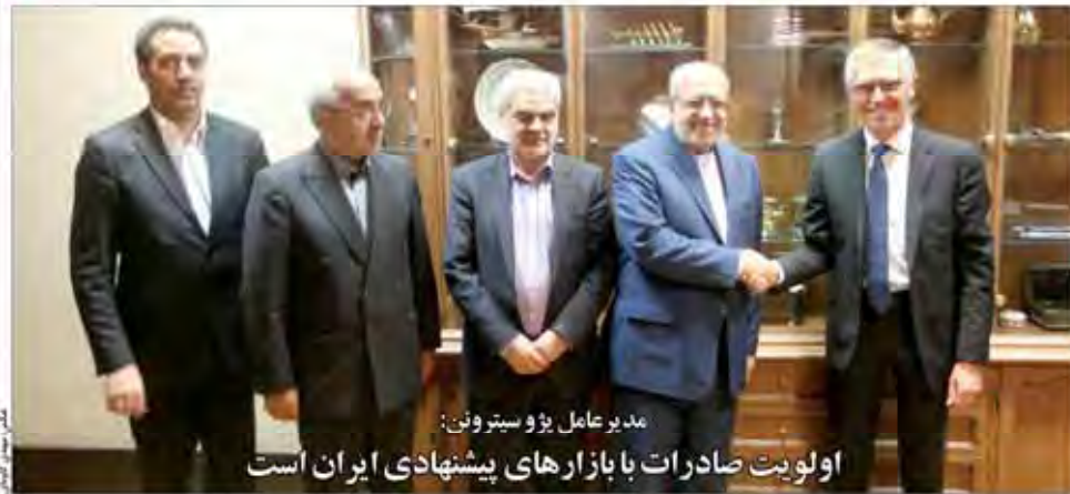
مدیر عامل پژ و سیتروئین:

فاز نخست طرح ملی آمایش سرزمینی صنعت مصوب و تصویب شد. در طرح ملی آمایش سرزمینی صنعت، وزارت صنایع و معادن با همکاری وزارت نیرو، وزارت راه و ترابری و سازمان برنامه و بودجه، اقدام به تدوین این سند راهبردی کرده است.