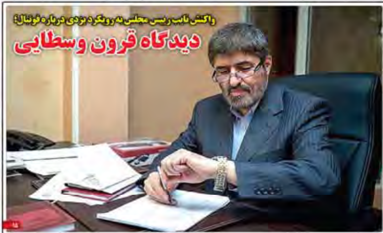
واکنش نایب رئیس مجلس به رونق بزرگ دربارۀ فونال؛ دیدگاه قرون وسطایی