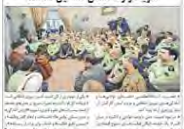
رکن عظیم امنیت را نیروهای انتظامی کارآمد شریف و زمکتکشی تشکیل داده‌اند.

سختگیری داعش در میان اصلاح‌طلبان خود را لو داد