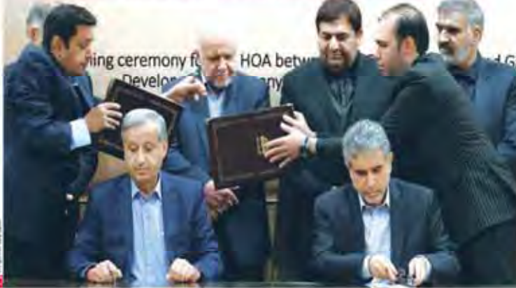
با عدل جدید قرارداد و برای اولین بار در «بازار جام» به انتشار رسید

شرکت ملی نفت و شرکت توسعه صنایع نفت و گاز و پتروشیمی با سه شرکت ایرانی قرارداد همکاری به ارزش ۲ میلیارد دلار امضا کردند.