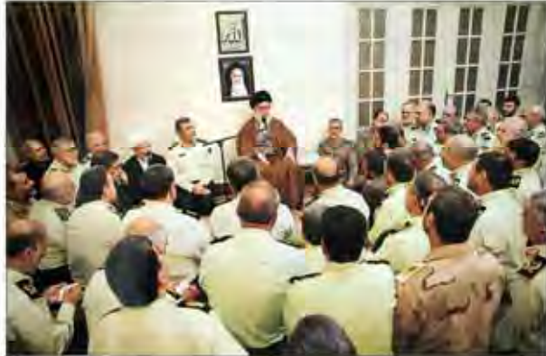
امینیت: رکن اساسی پیشرفت کشور حضرت آیت‌الله خامنه‌ای در دیدار فرماندهان نیروی انتظامی: باید به نقش کلان‌تری‌ها که با آزاد جامعه مستقیم مواجهند توجه ویژه داشت.

واشنگتن، ۱۴ مهر - روسیه و آمریکا در گفت‌وگو با هم هدف از کاهش تنش‌ها و همکاری بیشتر است. روابط بین‌المللی و همکاری بیشتر است. هدف از کاهش تنش‌ها و همکاری بیشتر است.