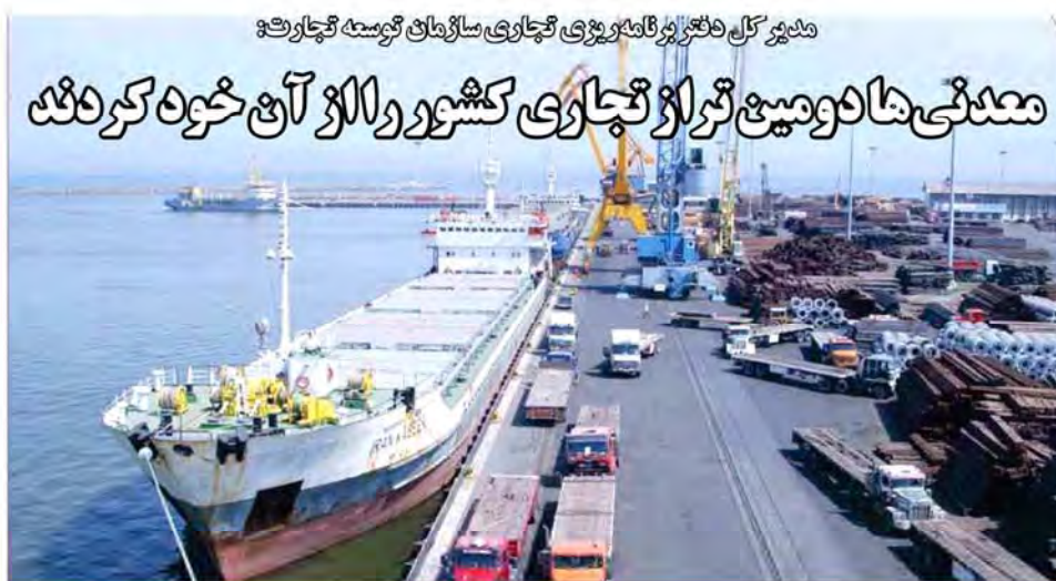
مدیر کل دفتر برنامه‌ریزی تجاری سازمان توسعه تجارت: