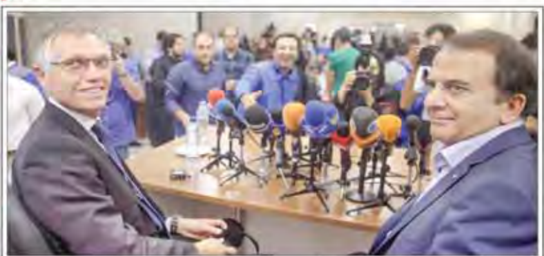
یارکشی خودروسازان علیه دولت یک هفته بعد از قرارداد رو قرارداد بزرگ ایران خودرو رونمایی شد