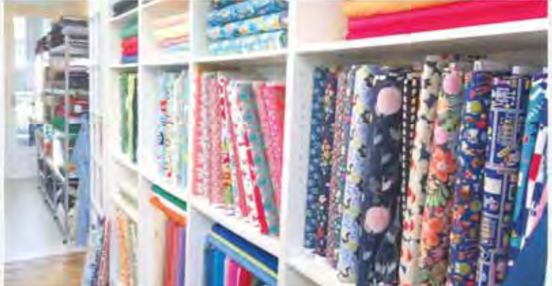
رئیس اتحادیه باغکاران پارچه در گفتگو با جهان اقتصاد تشریح کرد...

رویکرد گسترده‌تر به آسیا گریز از بدهی غربی‌ها سفر منطقه‌ای دکتر حسن روحانی رئیس‌جمهوری به کشورهای تایوان، تایلند و مالزی در جریان سفر به شرق آسیا، دستاوردهای مهمی را در بر داشت. نخستین دستاورد این سفر، توافق بر سر راهکارهای همکاری اقتصادی و بازرگانی میان ایران و این سه کشور است. این توافق‌ها زمینه‌ساز توسعه روابط اقتصادی و سیاسی با این سه کشور خواهد بود. همچنین، این سفر فرصتی برای کاهش وابستگی ایران به اقتصاد غربی و توسعه روابط با کشورهای آسیای شرقی را فراهم کرد.