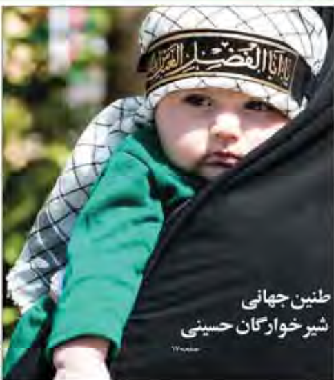
طین جهانی شیر خوارگان حسینی