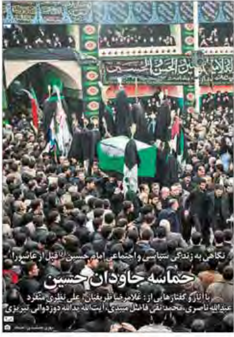
نگاهی به زندگی تنبلی و اجتماعی امام حسین (ع) قبل از عاشورا حماسه جاودان حسین با آثار و گنازهای از: غلامرضا ظریفیان، علی نظری، منصور عبداللله ناسری، محمد تقی فاضل میبیدی، ای‌الله بدالله دوزدانی، تیریزی

سده قوت برهمنی جبار در این سده بی‌سود و بی‌انصاف است عاشورا نمودگار بقا و مظلومیت شیعه و مظلومیت شیعه است