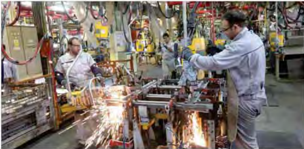
مشکل معادن آلومین