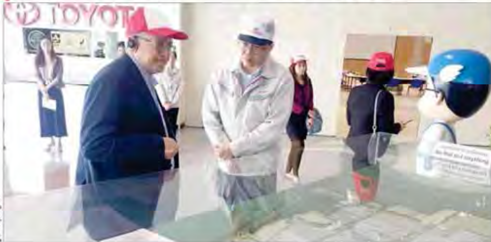
شماره تصویر: صنعتی