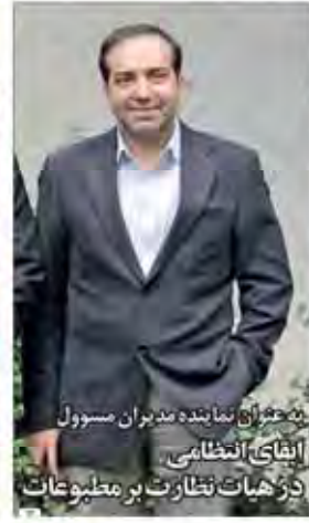
به عزت نماینده مدیران مسوول اینگذای العظامی در هیات نظارت بر مطبوعات