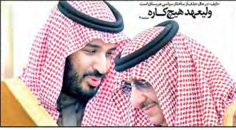
ولیعهد هیچ کاره ولیعهد هیچ کاره... ولیعهد هیچ کاره...