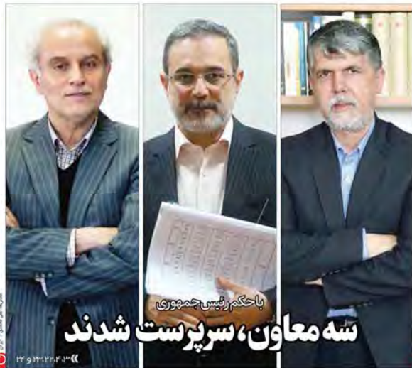
سید عباس صالحی، سید محمد بطحایی، سید نصرالله سجادی وزارت فرهنگ و ارشاد اسلامی، وزارت آموزش و پرورش، وزارت ورزش و جوانان

تجدید فروش سراج هنری ۴ میلیون دلار بود فروشگاه «هنر ایران» (ای بی بی سی) به نحو اختصاصی ۵۰