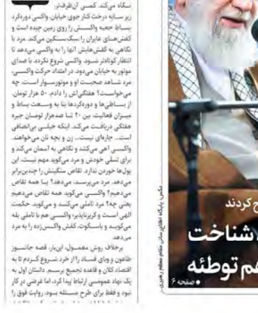
مقام معظم رهبری مطرح کردند تکرار کلمه دشمن، شناخت توطئه است نه توهم توطئه

مقاله‌ای در مورد پشت پرده تغییرات کابینه. تغییرات کابینه می‌تواند نشان‌دهنده تغییر در سیاست‌های دولت باشد. تحلیل این تغییرات می‌تواند به درک بهتر اهداف دولت کمک کند.