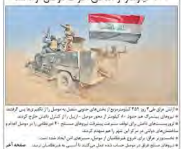
تنها ظرف ۳ روز ۴۰۰ کیلومتر از مناطق اطراف موصل آزاد شد

در گفت‌وگو با خبرنگاران، آیت‌الله خامنه‌ای تأکید کردند که دشمنان با هدف توقف حرکت علمی ایران، با ایجاد موانع و تحمیل بارهای اضافی سعی می‌کنند که ایران در زمینه‌های علمی عقب‌مانده بماند. رهبر انقلاب تأکید کردند که باید با تمام توان در زمینه‌های علمی پیشرفت کرد و از دست‌اندرکاران انتظار داشت که با جدیت و کوشش در این زمینه فعالیت کنند.