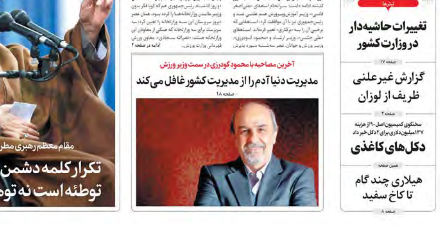
آخرین مصاحبه با محمود گودرزی در سمت وزیر ورزش مدیریت دنیا آدم را از مدیریت کشور غافل می‌کند

مقاله‌ای در مورد فساد خرد تا فساد کلان. فساد در جامعه به اشکال مختلفی بروز می‌کند و اگر کنترل نشود، می‌تواند به فساد کلان منجر شود. مبارزه با فساد نیازمند اراده قوی و اقدامات جدی است.