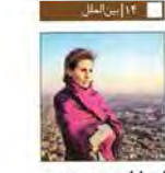
اسماء اسد: سوریه روی پای خود می‌ایستد

ثبت نام مجازی از مرز ۴۱ درصد گذشت مشارکت ایرانیان رتبه اول جهان در سرشماری اینترنتی یادمان دومین سالگرد رحلت آیت‌الله مبنوی کنی، جای خالی یار دیرین انقلاب تاوان سنگین ردیابی اشتباه مخابراتی / بی‌گناهی که از پای چوبهدار برگشت