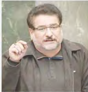
نایب رئیس فراکسیون امید: ترمیم کابینه ضروری بود