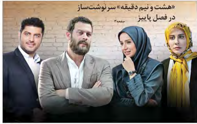
«هشت و نیم دقیقه سرنوشت ساز در فصل پاییزی» ۳ صفحه