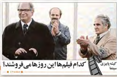
کدام فیلم‌ها این روزها می‌فروشند؟ کشته پاییزی سینما

روزنامه فرهنگی - اجتماعی صبح ایران - ۵ صفحه شماره ۱۳۵۵ - ۲۰ خرداد ۱۳۸۸ - ۲۰۱۶ شماره ۲۶۶۸ استان تهران و البرز - ۵۰ تومان / دیگر استانها ۳۰۰ تومان JAM-E-JAM Vol.17 No.4668 SAT OCTOBER 22, 2016