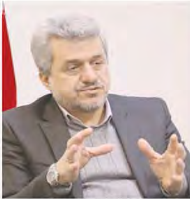
انتقاد از احداث ۳۰۰ هزار حلقه چاه شیر مجاز غارت منابع آب