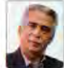
محمد رضا بهرامن رئیس خانه معدن ایران