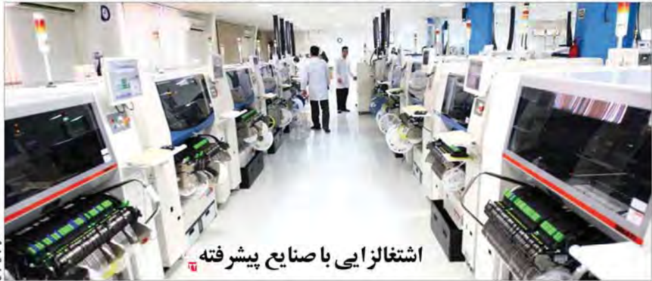
اشتغالزایی با صنایع پیشرفته

بر اساس اطلاعات به دست آمده از تعداد ایده‌های تبدیل شده به محصول در پارک‌های علم و فناوری و مراکز رشد ۱۱۳۰ مورد در سال ۱۳۸۴، ۱۲۳۸ مورد در سال ۱۳۹۲ و ۱۲۹۲ مورد در سال ۹۴ بود و در ۳۳۰۵ ایده تبدیل به محصول شده است. همچنین تعداد ایده‌های تبدیل شده به محصول که تجاری‌سازی شده است ۵۴۹۰ مورد در سال ۱۳۸۴، ۱۰۰۰۸ مورد در سال ۹۴ و ۷۷۳ مورد در سال ۹۵ بوده است.